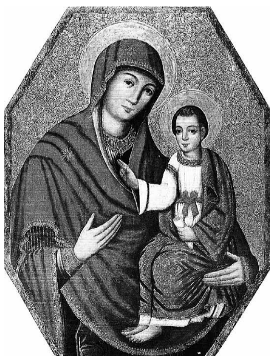
Ярославська Богородиця “Милосердя двері”.

1.05 — Світле Христове Воскресіння (передбачена ретрансмісія торжеств на антені TVP1 з Архієпархії Перемисько-Варшавської); 2.05 — Світлий Понеділок — Лігниця, Архвєрейська Божественна Літургія; 3.05 — Світлий Вівторок; розпочинається Світлий тиждень (загальниці); протягом Світлого тижня в наших церквах служиться Воскрєсна Утрєня та Воскрєсна Вечірня; протягом Світлого Тижня священники моляться на кладовищах несучи померлим радісну вістку про Христове Воскрєсіння; 8.05 — Неділя Томина, Антипасхи; роздання Артоса; 14.05 — Загальноцерковна греко-католицька проща до Кракова-Лагєвник; 21.05 — Познань, Єпархіяльний Конкурс біблійного знання для молоді — «Книга Буття»; 22.05 — Неділя розслабленого; УГКЦ в Україні відзначає День хворих; відвідини хворих зі Святими Тайнами; уділення св. Тайни Миропомазання хворим у церквах; проповідь та молитва в наміренні хворих; 25–28.05 — Білий Бір, Реколекції для дружин священників; 30.05–2.06 — Священічі реколекції духовенства Перемисько-Варшавської Митрополії;