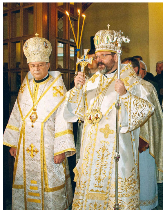
Блаженніший Святослав та Митрополит Євген Попович.