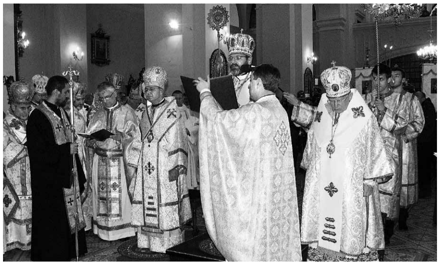
Початок торжественної літургії.

Закликаємо Тебе, згідно з поучанням Апостола народів, щоб Ти був «бездоганим, гостинним, добродушним, мудрим, справедливим, благочестивим, стриманим, який дотримується правдивої науки згідно з навчанням, щоб був здібний наставляти в здоровій науці та й супротивників переконувати» (Тит. 1, 7-9).