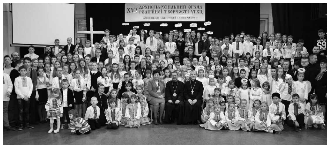
Спільне фото учасників свята з Митрополитом Євгеном Поповичом.

театральні міні-вистави, хоровий і сольний спів, читання поезій, пантоміма, презентації тощо. Вимова усіх для глядачів була очевидна — попрацюймо спільно над тим, щоби світ, у якому живемо, був кращий, відкиньмо щоденні спокуси й відкличмося до непроминаючих духовних вартостей, які кожен з нас має у собі, але не кожен ще їх відкрив.