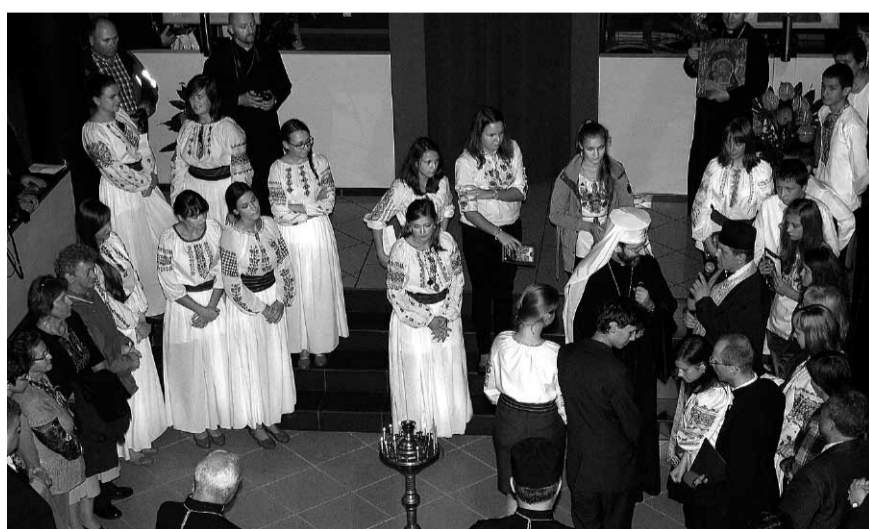
Зустріч з Блаженнішим Святославом. Білий Бір 14.09.2013 р.