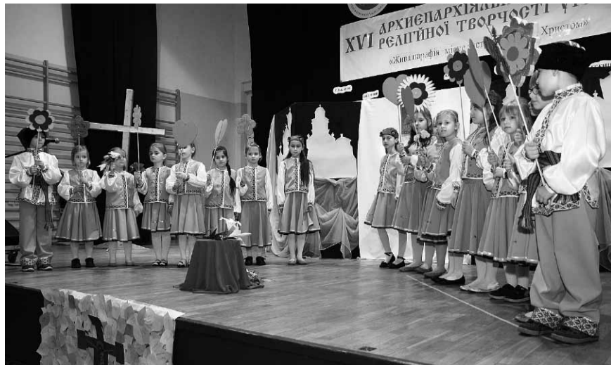
Діти з української школи в Бартошицях.

Під час цікавого й барвистого спектаклю, який продовжився на понад чотири години, його учасники використали усякі форми перекладу. Були ось запроєнтовані традиційні