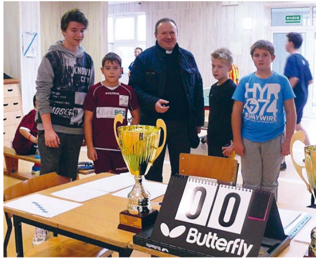
Найкращі отримали призи.

У цій групі додаткову нагороду признано дівчатам з Білого Бору. У фінальному матчі команда з Білого Бору перемогла М'ястко 2:1. Найбільше емоції викликав однак матч дівчат з хлопцями з Битова, в якому