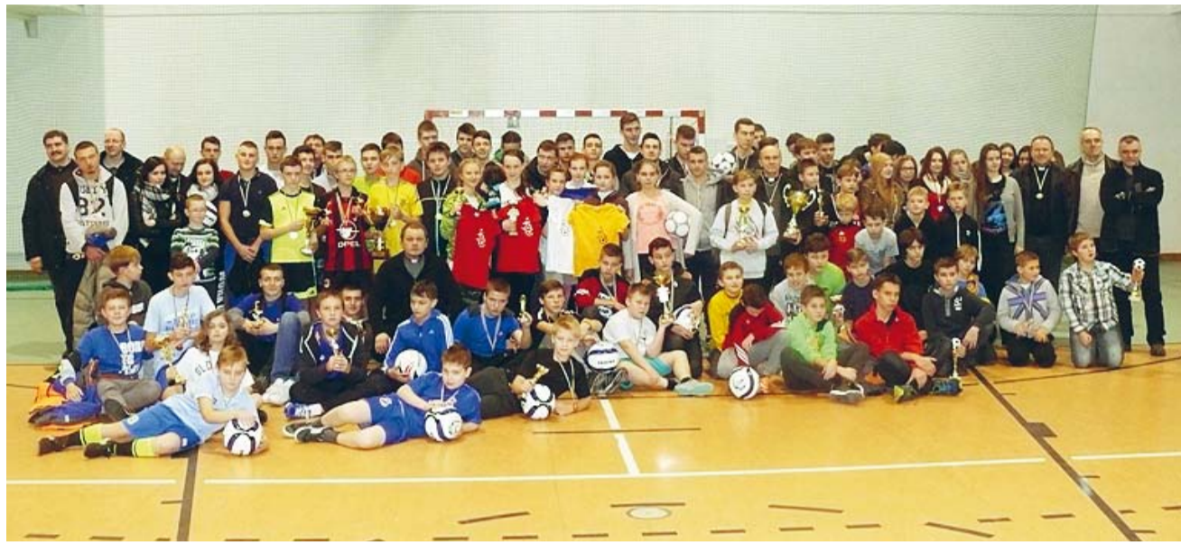
„Парафіяда” Вроцлавсько-Гданської єпархії.

Субота 13 грудня 2015 р. в Білому Борі минула під знаком греко-католицької „Парафіяди” Вроцлавсько-Гданської єпархії. Відбулися тут XIII Футбольні змагання з міні-футболу для хлопців та дівчат. Одночасно були проведені змагання в настільному тенісі. Змагання проведено для дітей та молоді з кошалінського та слупського деканатів. У змаганнях взяло участь 14 команд у двох категоріях: молодшій та старшій.