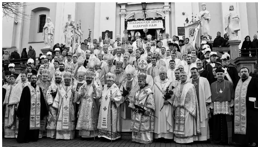
Спільне фото на закінчення торжеств у Перемишлі.