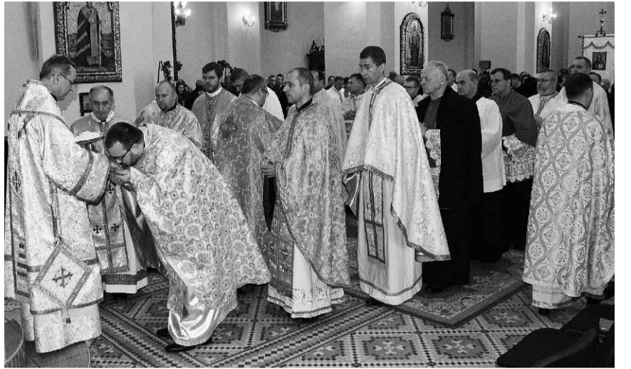
Вітання для нового Митрополита.

Своє архієрейське служіння здійснюватимеш відповідно до Кодексу канонів Східних Церков, партикулярних законів Української Греко-Католицької Церкви та декретів і вказівок її Отця і Глави. Пригадуємо Тобі важкий обов'язок бути вірним членом Синоду Єпископів УГКЦ і, згідно з приписами права, на кожний заклик Отця і Глави брати в ньому участь.