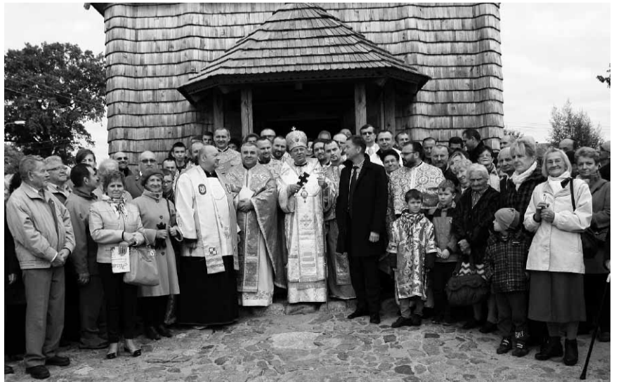
Спільне фото єпископа з вірянами на закінчення свята.