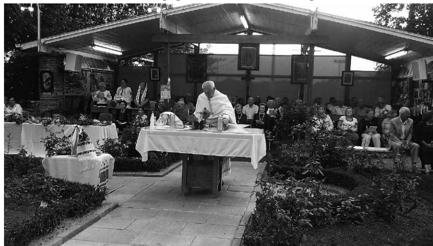
Свято Верхратської Божої Матері у Вестон, 28 серпня 2015 р.