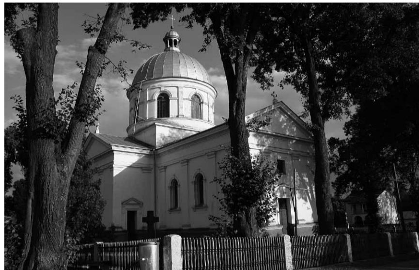
Церква у Верхраті.