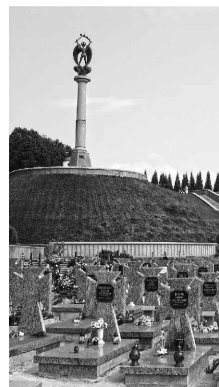
Меморіал воякам Української Галицької армії у Львові.

Уперше польсько-українська молитва примирення масово від-