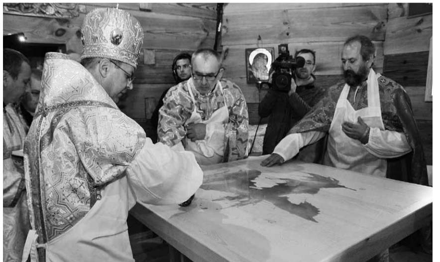
Чин посвячення престолу годковської церкви.