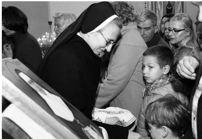
В день празника Сестри Службениці привезли для почитання ікону Блаженної Михайлини Гордашевської.