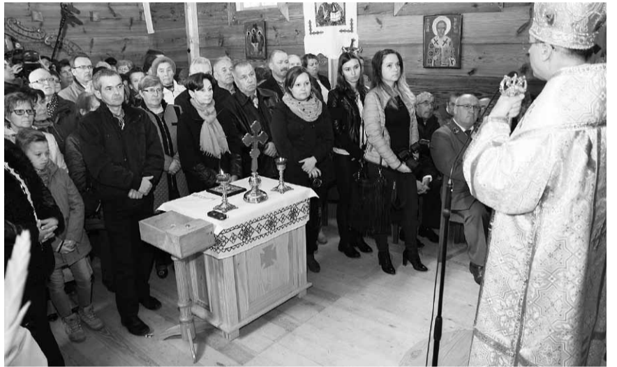
Слово Владики до вірян.