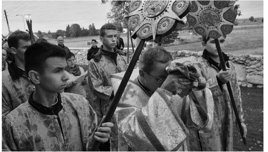
Процесія довкола церкви з мощами Блаженного о. Вергуна.