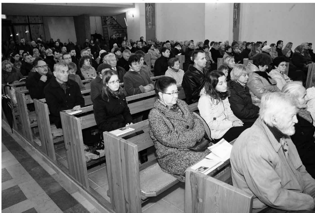
Вірняни гданської греко-католицької парафії.

Про особливе почитання Пречистої Діви Марії в нашому народі свідчить те, що багато храмів посвячених саме Богородиці. Зокрема пересвідчитися про це можна подорожуючи дорогами Західної України. Також й у Польщі. маємо багато церков саме під покровом Пресвятої Богородиці.