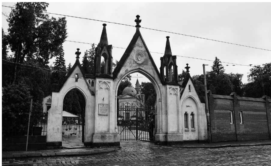
Головний вхід на Личаківське кладовище.

булася 1 листопада 2002 року за участю кардиналів Любомира Гузара та Мар'яна Яворського, дисидентів Яцека Куроня, Михайла Гориня, Мирослава Мариновича та ще близько сотні громадських діячів з України та Польщі. Така акція стала ініціативою поляків та українців, які виступили за діалог, порозуміння та поєднання між двома народами.