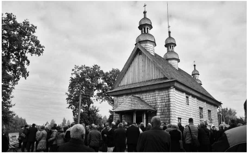
Церква з Купної, що опинилася в Годкові.