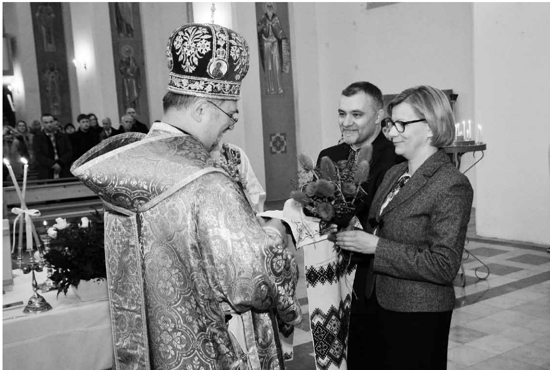
Вітаємо вас, Владико, у порогах нашого храму.