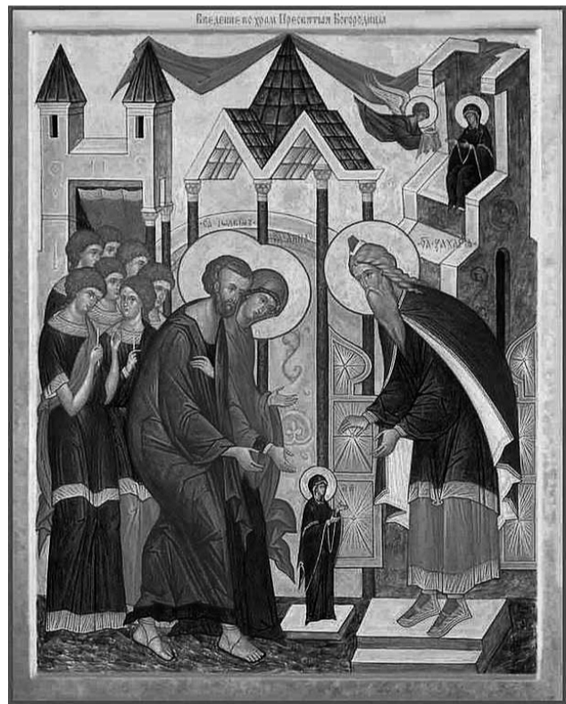
Ікона Празника Входу у храм Пресвятої Богородиці.

ту для Бога, своєї Церкви й народу. Щораз менше в нас батьків, які за прикладом святої Анни були б готові сказати нашій Церкві: «Прийми дитину, яку Бог мені дав»».