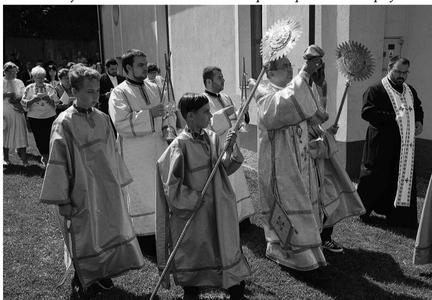
Процесія з мощами блаженних Пратулинських мучеників.