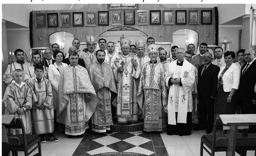
Традиційна фотографія на закінчення Літургії.