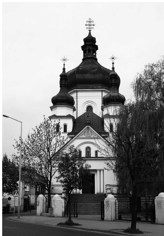
Церква Співстраждання Пресвятої Богородиці на Засянні в Перемишлі.

На свято Чесного і Животворящого Хреста, в 1997 р., Преосвященний Митрополит Перемишльсько-Варшавський Архієпископ Кир Йоан Мартиняк і Владика з Канади, Северіян Якимишин (ЧСВВ), довершили посвячення хрестів на всі три куполи. Щоб будівлі надати вигляд церкви, хрести було поставлено на копулах тимчасово, бо дах і куполи потребували ремонту, якого в той