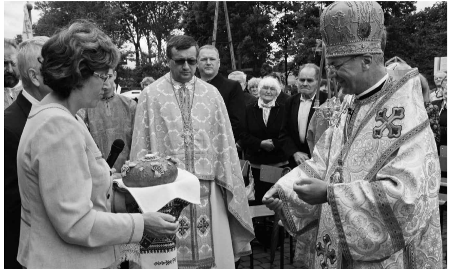
Хліб та сіль від паломників.