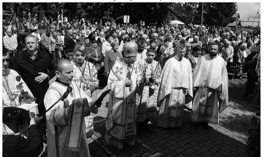
Проща закінчилася Панахидою за б. п. о. Ріпецького та його дружину.