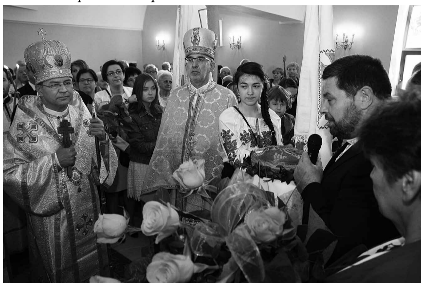
Владика Євгена Поповича вітають віряни орнетської парафії.