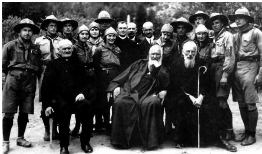
Підлюте, Шептицький з проводом пластового табору.

Андрей Шептицький інформував Апостольську столицю, зокрема святих отців, про церковну, релігійну, суспільну, політичну ситуацію, говорив про ті потреби, які переживає український народ, писав і про Голодомор в Україні у 1932–1933 роках, просив світ про допомогу для українського народу і не мовчати на зло, закликав відомих людей захищати українців і їхнє право на незалежну держа-