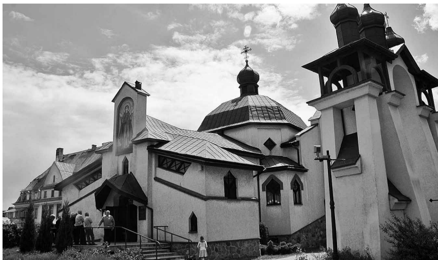
Храм св. Василя Великого в Кентшині.