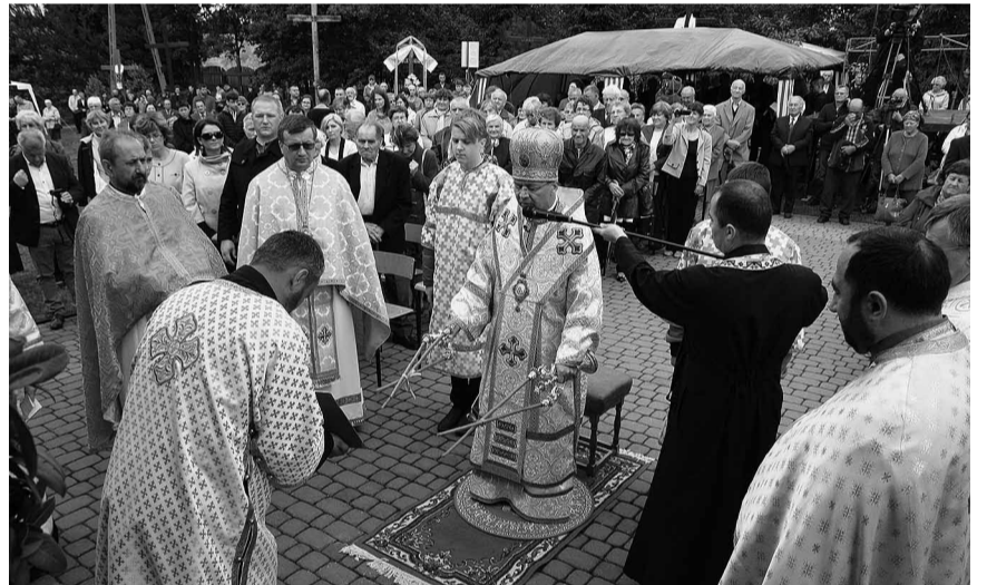
Починається Божественна Літургія.