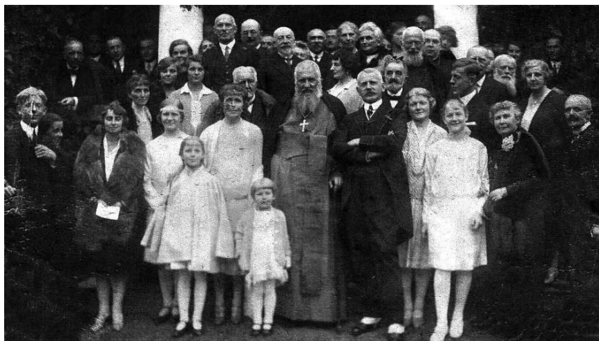
Родина Шептицьких з Митрополитом Андреем.

«Якби я був народився французом чи англійчиком, я був би то саме зробив, так само я вступив би до чину, до монашого чину східного обряду... Посвячуючись Східній Церкві, справі унії, я мав на оці лиш мотив всесвітнього характеру», — писав Митрополит Шептицький про те, чому він обрав саме УГКЦ.