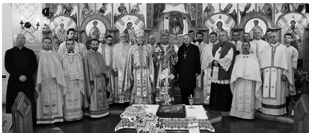
Спільна фотографія на закінчення Літургії.