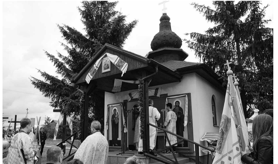
Каплиця на прицерковному майдані.