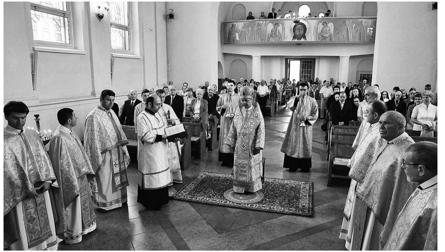
Святкова Літургія у василіянській церкві на перемиському Засянні.

Нажаль, лише 10 років церква служила не лише монахам, але й вірянам Перемишля та околиць, бо вже у жовтні 1945 р. Служба Безпеки (УБ) комуністичної Польщі, наказала оо. Василіанам покинути свій монастир і церкву, щоб таким чином затерти всякі сліди існування в Перемишлі монастиря (ЧСВВ), монастирської церкви і українців загалом. Будівлі монастиря і церкви призначено на потреби Воевідського державного архіву. За наказом уряду Перемишля, обитель мала бути пристосована до потреб архіву, але у такий спосіб, щоб втратила сакральний характер і ніколи більше не могла слугувати потребам релігійного культу. Із всіх трьох куполів знято хрести. Усередині церкви споруджено залізобетонні стропи, які роздерли нутро на 3 частини, установлено ліфт і побудовано залізні сходи, брутально зруйновано іконостас і всі розписи, розібрано зовніш-