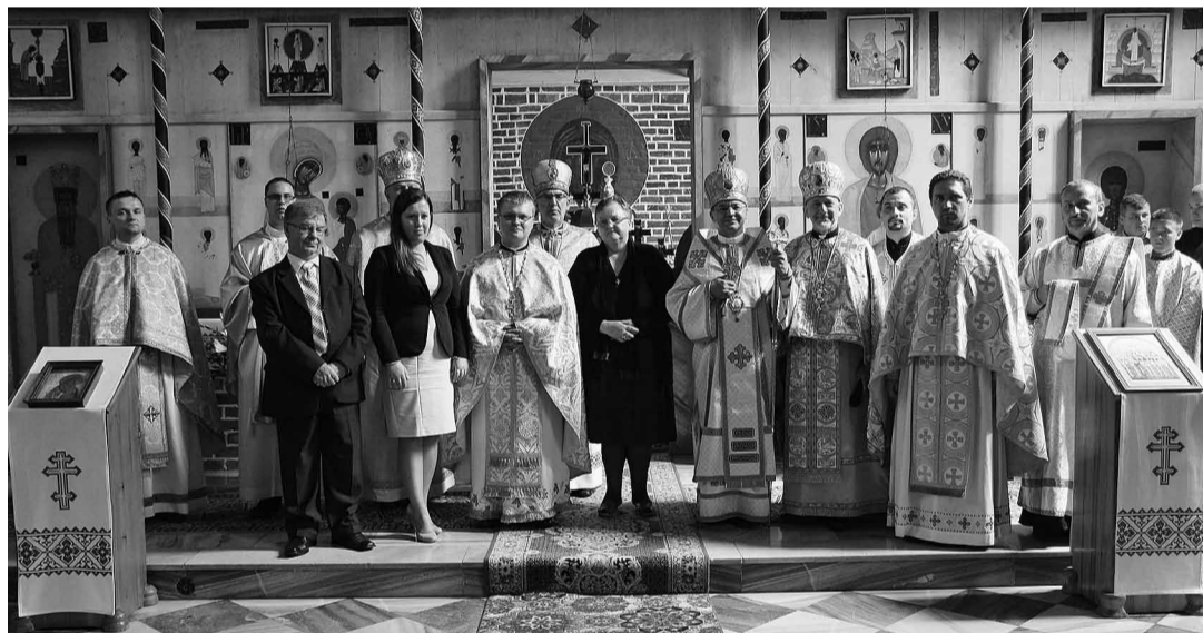
Новоієрей з Владикою, співсвятителями та родиною.