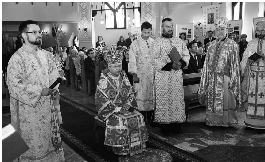
Початок святкової Божественної Літургії.