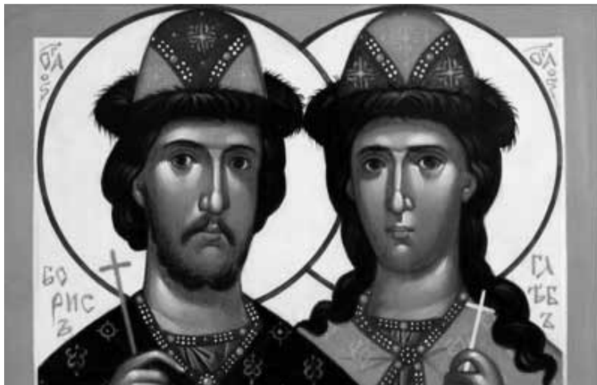
Святі Борис та Гліб.

Після смерті князя Володимира 1015 року кияни покликали Бориса, щоб він зайняв великокняжий престол згідно з останнім бажанням князя Володимира. Однак один із синів князя — Святополк Окаяний — самовільно зайняв княжий престол у Києві, скориставшись відсутністю Бориса. Борис і Гліб не противилися діям свого брата, а закликали його до пошани християнських засад. Святополк у своїй люті наказав воякам убити братів: Борисові пробив мечем серце, а Глібові перерізали горло 1015 року.