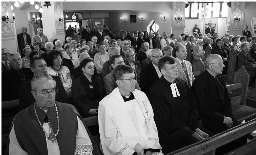
Запрошені на празник парафії та церкви достойні гості.