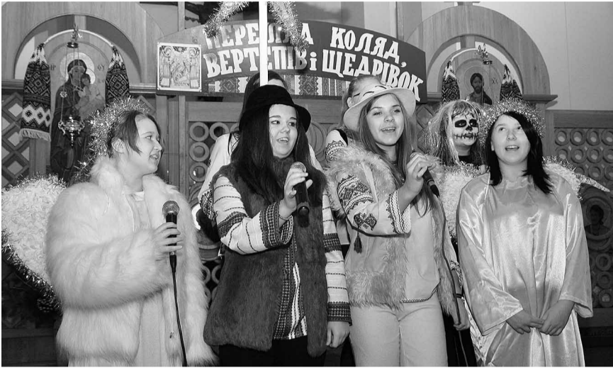
Виступають учні гурово-ілавецької гімназії.