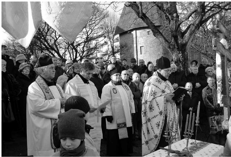
Водосвяття у Слупську.

Свято Богоявлення, за Юліанським календарем відзначемо 19 січня (6 січня — за Григоріанським), воно завершує цикл Різдвяних свят. За традицією, де тільки є така можливість, процесійно йдемо над воду, чи буде це річка, озеро чи ставок, щоби освятити воду.