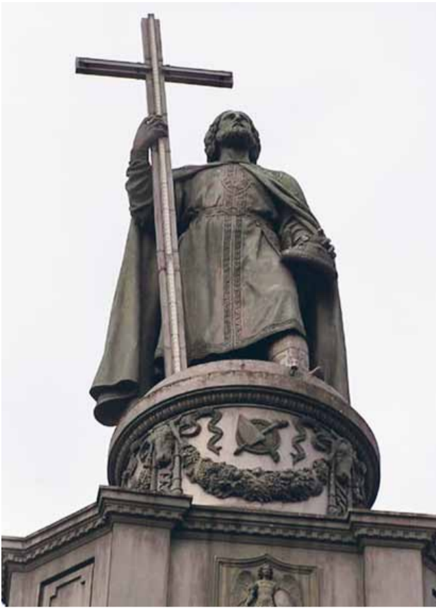
Пам'ятник Володимирові Великому в Києві.

«(...) з досвідом століть та з тою самою вдячністю, що й усі наші предки, величаємо Всевишнього за дар християнства. Цей дар зробив наш нарід народом Божим, народом святим, народом християнським і культурним та в довгому ряді століть давав нам усе силу поборювати всі труднощі життя й зберігати спадщину дідів та прадідів, передаючи її будучим поколінням».*