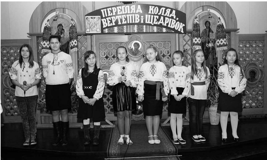
Діти з Венгожева.