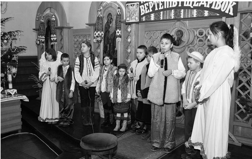
Діти зі Срокова.