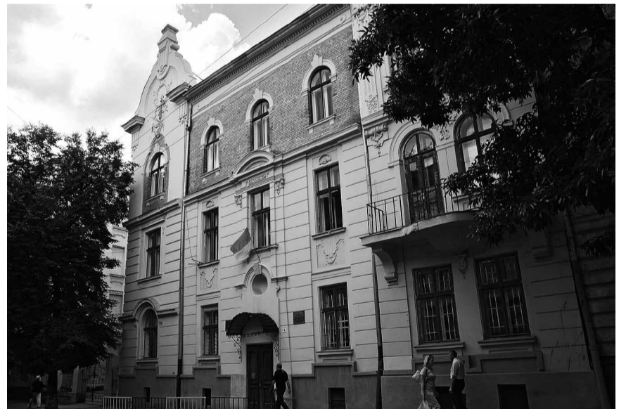
Польська школа № 24 ім. Марії Конопницької у Львові.