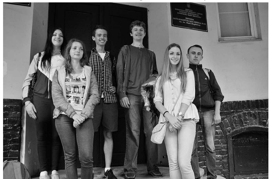
Учні польської школи №10 ім. св. Марії Магдалини у Львові.