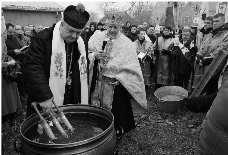
Водосвяття у Гурові Лавецькому.