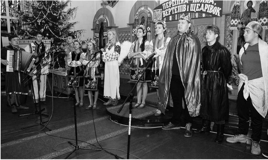
Вертеп з гурово-ілавецького ліцею.