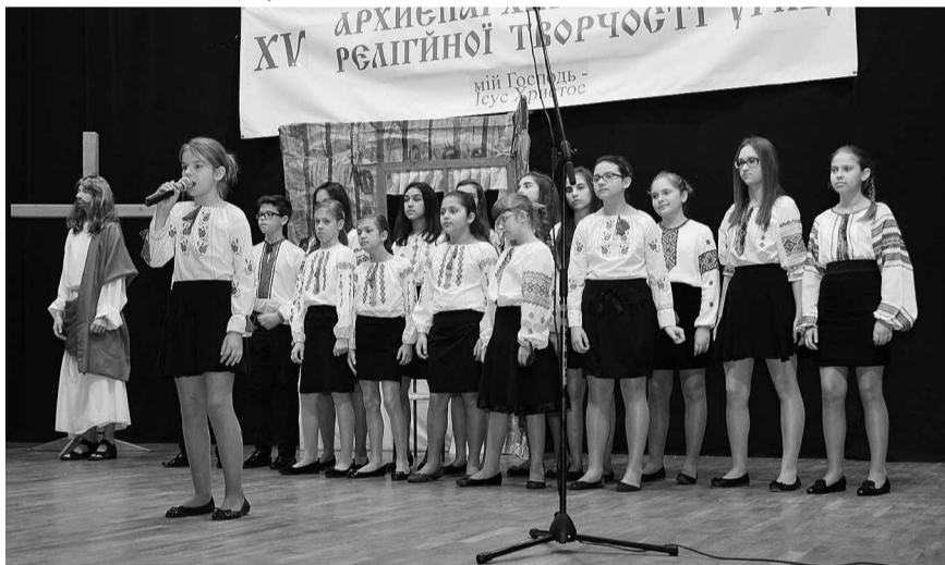
Хор з Ольштина.