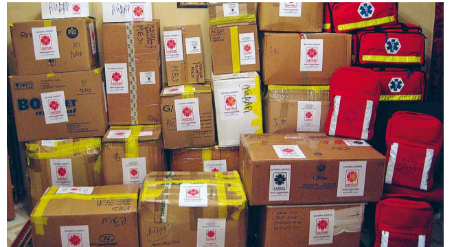
Медична допомога Україні.

польської пошти сприяла мобілізації багатьох осіб та інституцій взяти участь у благородній акції. Необхідно зазначити, що Карітас України надала свою базу даних стосовно потребуючих, якими вони опікуються. Завдяки цьому, за співпраці з Щецинським відділенням Об'єднання українців у Польщі та учнями 20 шкіл зі Щецина та околиць безпосередньо для потребуючих відправлено понад 180 посилок, загальною вартістю майже 18.000 зл.