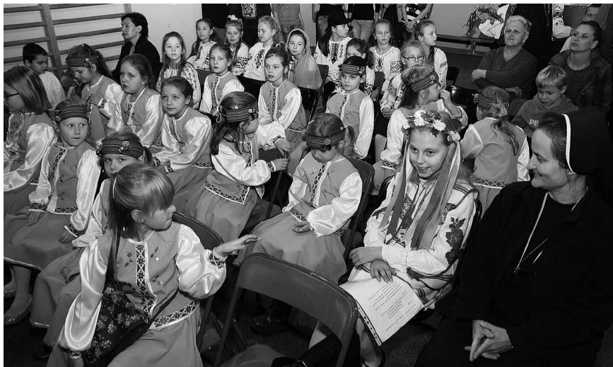
Діти з української школи в Бартошицях.

зі зворушенням відзначив, що щиро радіє з праці та зусиль молоді й дітей, але також опікунів, катехитів, батьків та вчителів: «Ви не жаліли сил і праці, готові були підготувати виступи та приїхати тут, до Гурова. Приїхали порадувати нас й освітити, щоби ми після концертів поїхали до своїх домів підбудовані, з певністю, що через рік тут знову появимося. Ми разом з вами творимо одну