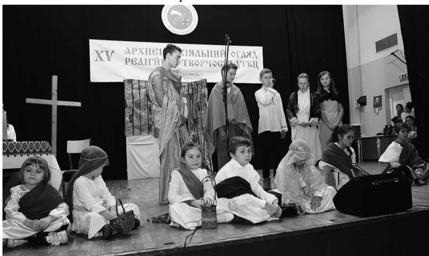
Діти з Ельблонга.