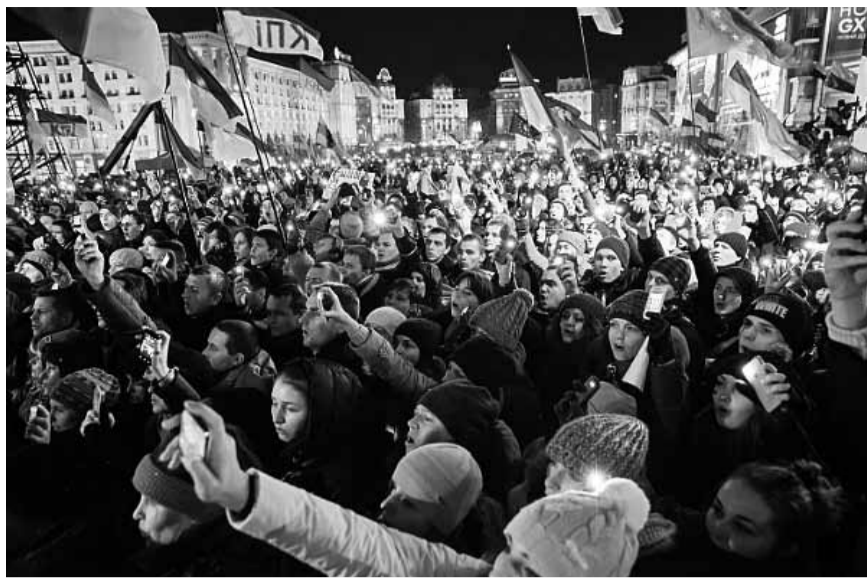
Мітинг на Євромайдані 2014.

У Львові 2001 р. Папа Іван Павло II коли проголошував блаженними 27 українських мучеників комуністичного режиму, сказав, що хотів б бачити Митрополита Андрея Шептицького в лику святих. Яюсь так складається, що про такого духовного провідника не можна казати, як про святого. У 2006 р. Кардинал Гузар сказав, що не має чуда і на можна визнати його святым. Думаю, це завдання для нас, щоб ми постійно за заступництвом Митрополита заносили молитви до Бога і вкінці, щоб ті молитви принесли це чудо. Але думаю також, що це чудо вже є, це історія УГКЦ