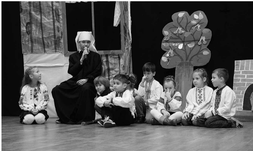
Виступають діти з Пасленка та Годкова.