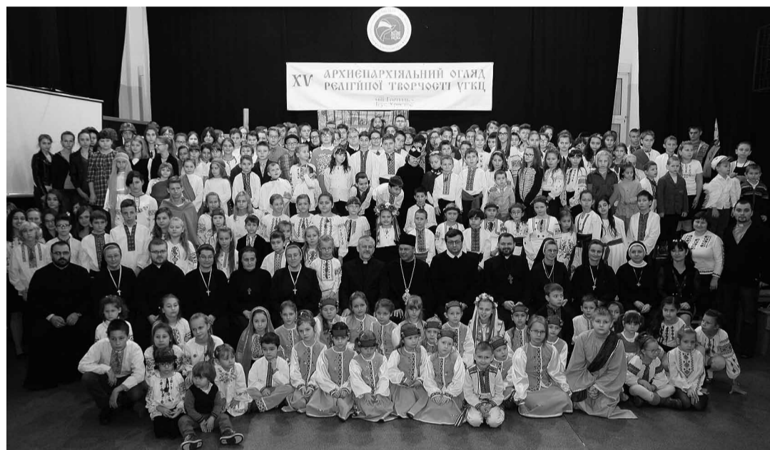
Артисти зі своїми вихователями та батьками на початку Огляду.

Перемиської Архиепархії. Цього року прибуло 15 гуртків, а разом близько трьох соток виконавців — від дошкільнят по ліцейську молодь. Молоді артисти їхали до Гурова Іл. з Пасленка і Годкова, Гіжицька, Бань Мазурських, Ельблонга і Млинар, Бартошиць, Любліна, Лелькова, Кандит, Ольштина, Варшави, Венгожева. Не забракло, звичайно, місцевої молоді з Комплексу шкіл та початкової школи.