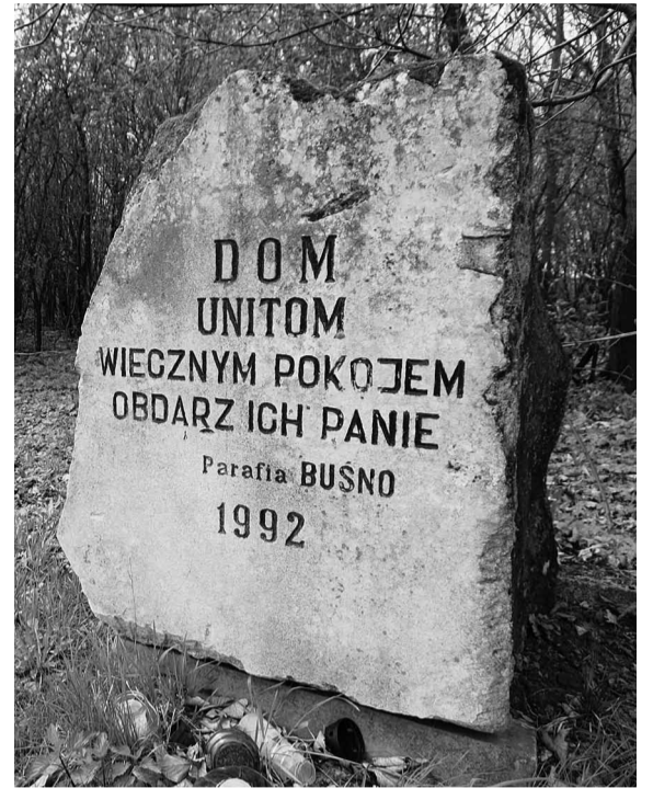
Пропам'ятний камінь у Бусні.

Церква у Бусні (гміна Білополе) своїм виглядом східного храму не нагадує. Вона була збудована на місці старшої у 1773 році коштом єпископа Максиміліана Риллау Був це мурований бароковий храм з двома вежами на фасаді і куполом посередині даху. Від 1875 р. — православний. Після Першої світової війни церкву перетворили на римо-католицький костел Успіння Пресвятої Богородиці. Вигляд церкви на сучасний змінився у 1925 р., коли-то бані, що вкривали обі вежі фасаду, замінено високими шпильями, добудо-