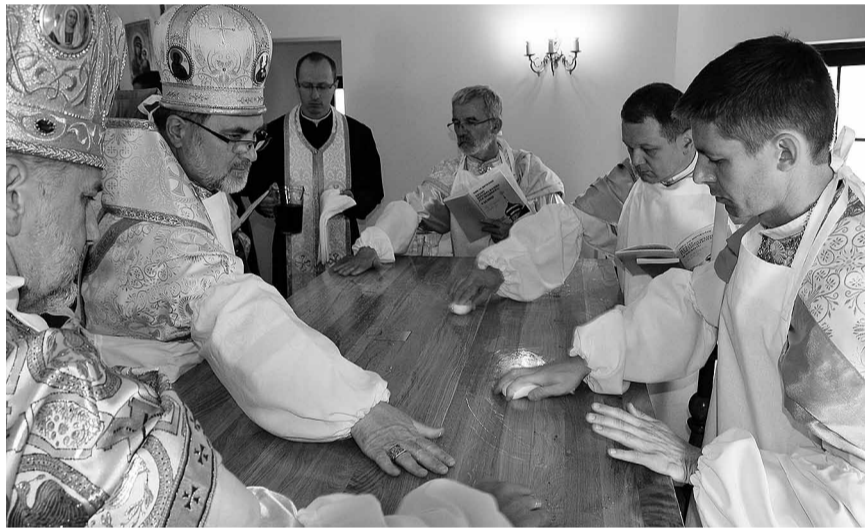
Соборне посвячення жертвника білицької церкви.