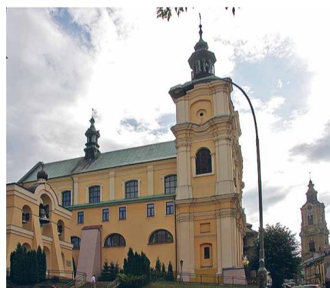
Новий храм УГКЦ у Польщі