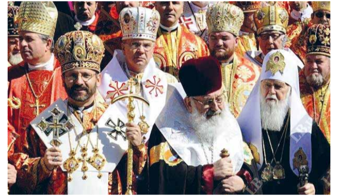
Блаженніший Святослав та Любомир з Патріархом УПЦ КП Філаретом. 2011 р.

17 вересня виповниться 25 років з того часу, як УГКЦ вийшла з підпілля після років переслідування радянським режимом, коли, за словами Патріарха Святослава, «на Свято-Юрську гору прийшло чверть мільйона людей, котрі публічно виявили свою приналежність до переслідуваної УГКЦ».