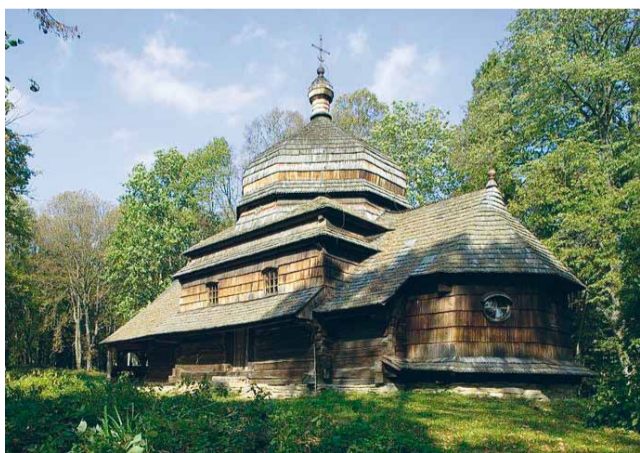
Церква в Улючі.