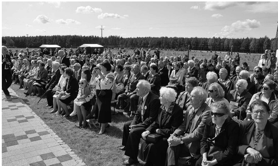
У торжестві взяли участь вірні з довоколишніх парафій.