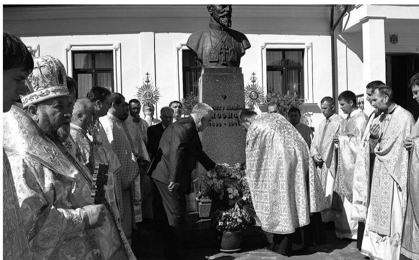
Покладення квітів під пам'ятником Патріярху Йосифові Сліпому.