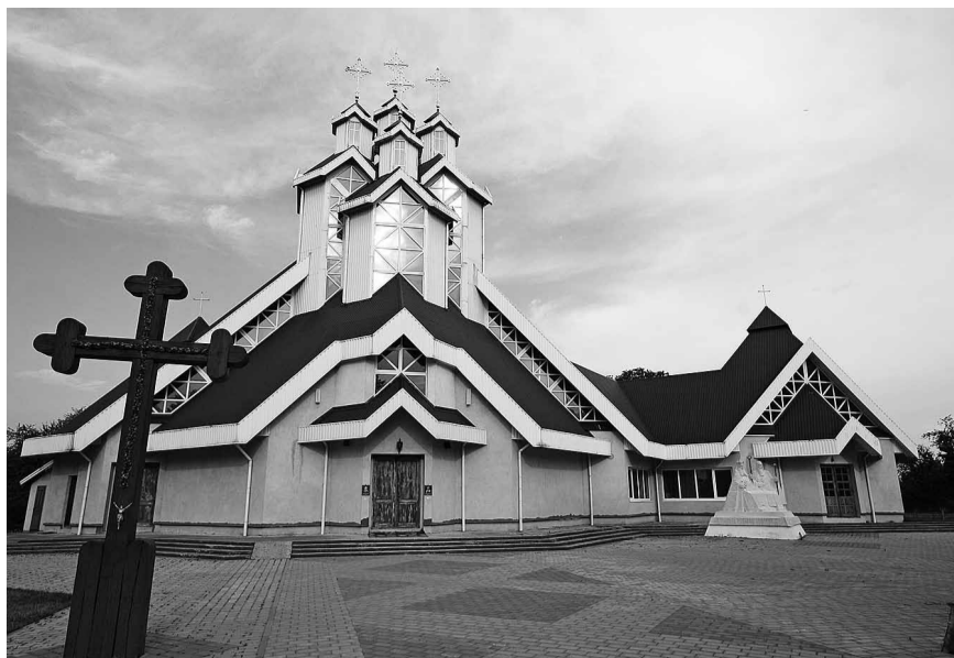
Греко-католицька церква у Прилбичах.