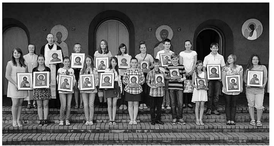
На закінчення художніх навчань у Білому Борі — спільне фото.

На завершення — в тиші і зосереджені вірні молилися Ісусовою Молитвою.