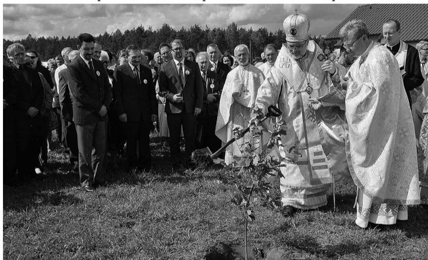
Урочисте посадження дерева пам'яті.