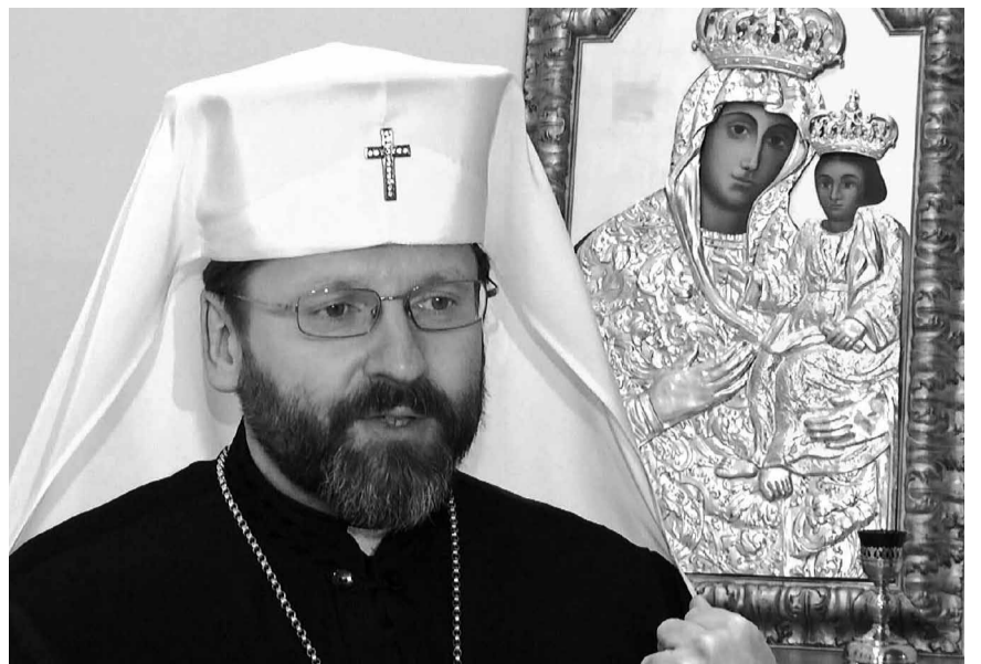
Блаженніший Святослав — Глава УГКЦ.

КАІ: Чи в цьому контексті слід розуміти концепцію «руського міра», проголошену Патріархом Кирилом, що означає покликання Росії до духовного проводу у світі слов'янських православних країн?