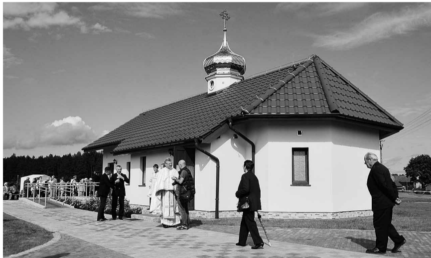
Нова білицькв церква.