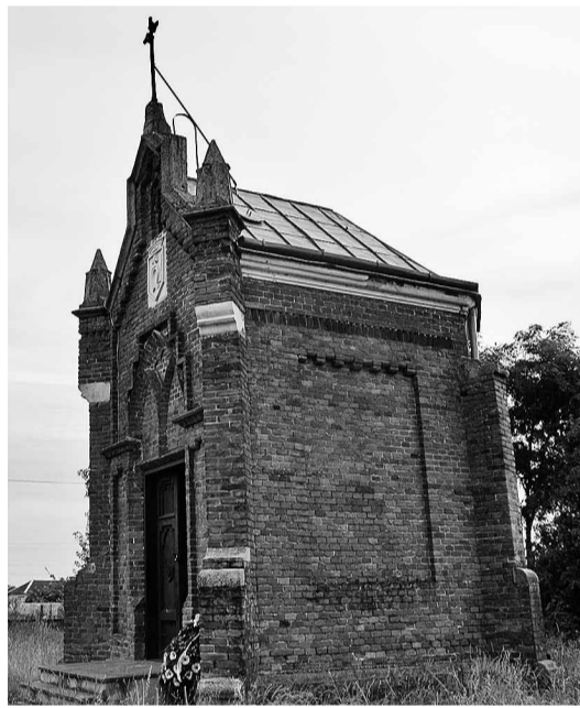
Каплиця-усипальниця Шептицьких — одно, що залишилося від усієї давньої забудови.

Керуючися такими інформаціями, віднайденими на українських офіційних сайтах, їдемо у Прилбичі (Яворівський район, Львівська область), давнього маєтку родини Шептицьких, щоби відвідати місце, де побачив світ і провів юнацькі роки князь УГКЦ, Митрополит Андрій Шептицький.