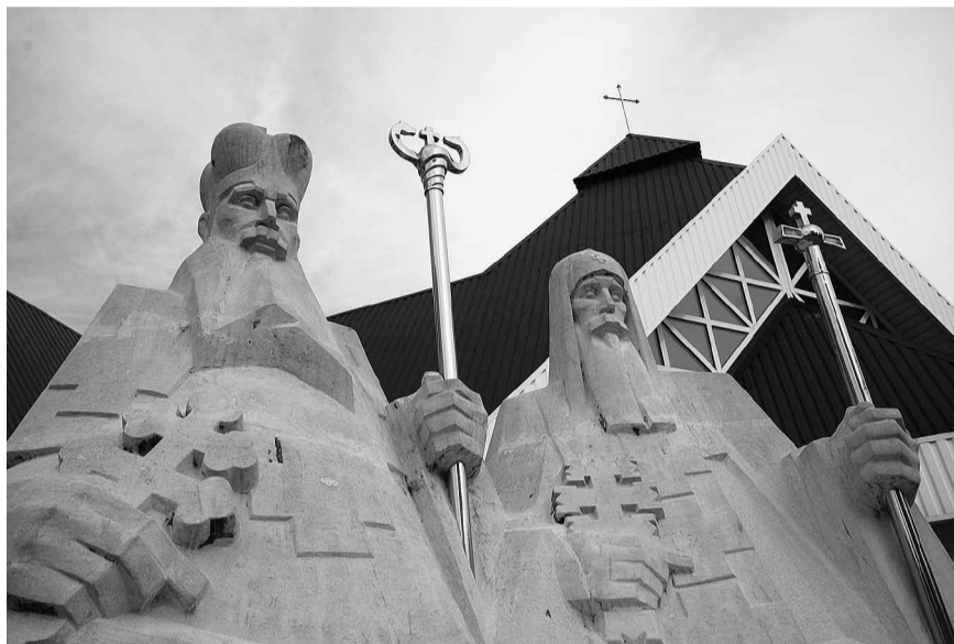
Пам'ятник братам Шептицьким — Митрополиту Андрею та Архимандриту Климентію.

комплектувати його син Леон, нараховувала 6000 томів.