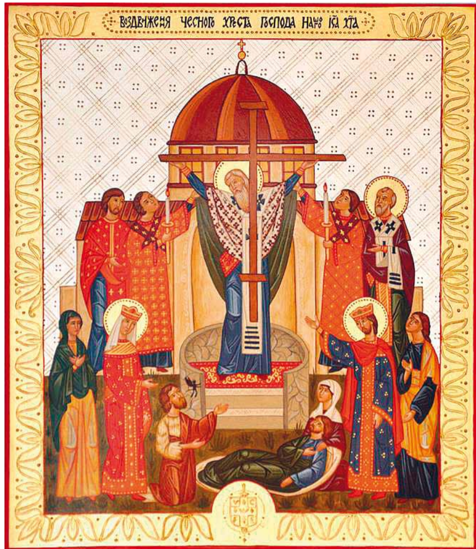
До празника Воздвиження Чесного Хреста