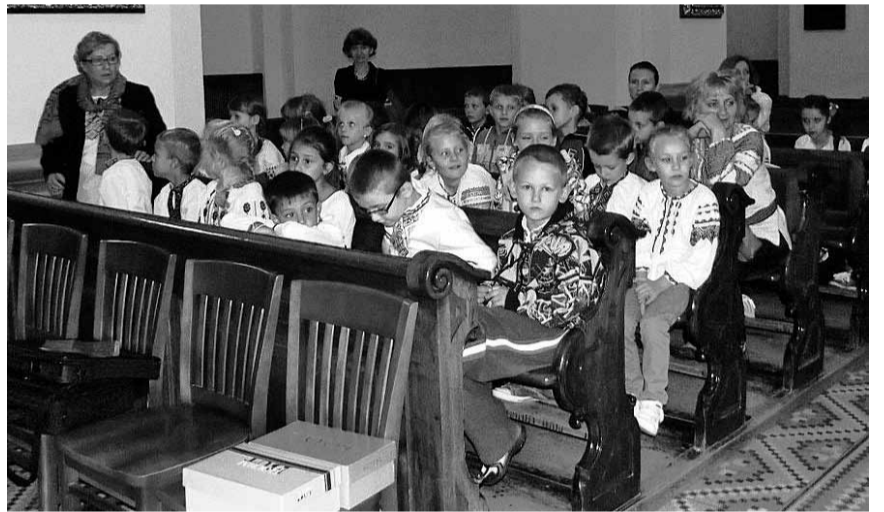
Молитва наймолодших перемишлян в наміренні України.