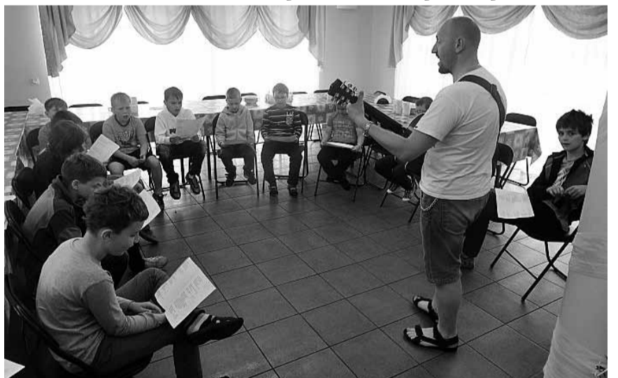
Спільне навчання співу.