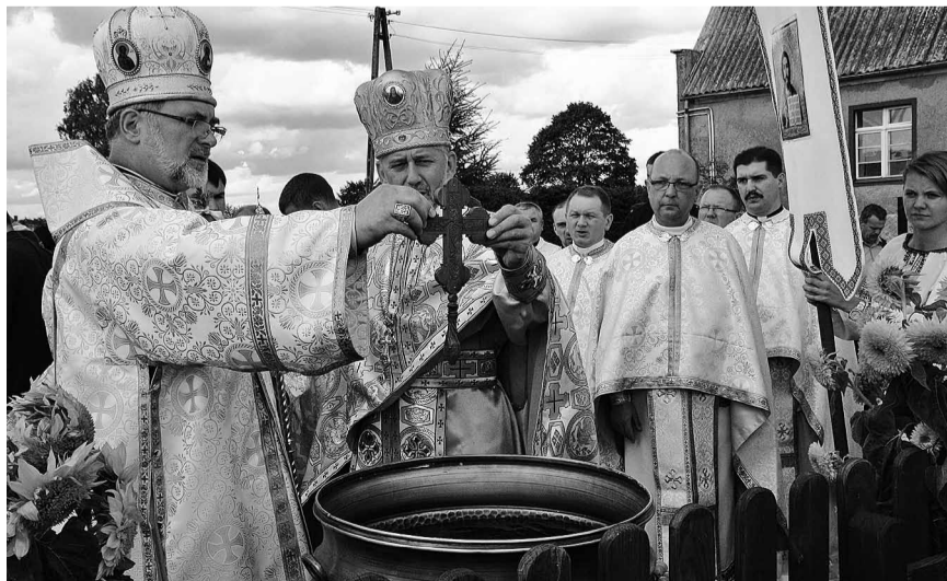
Посвячення води на обильні потреби.