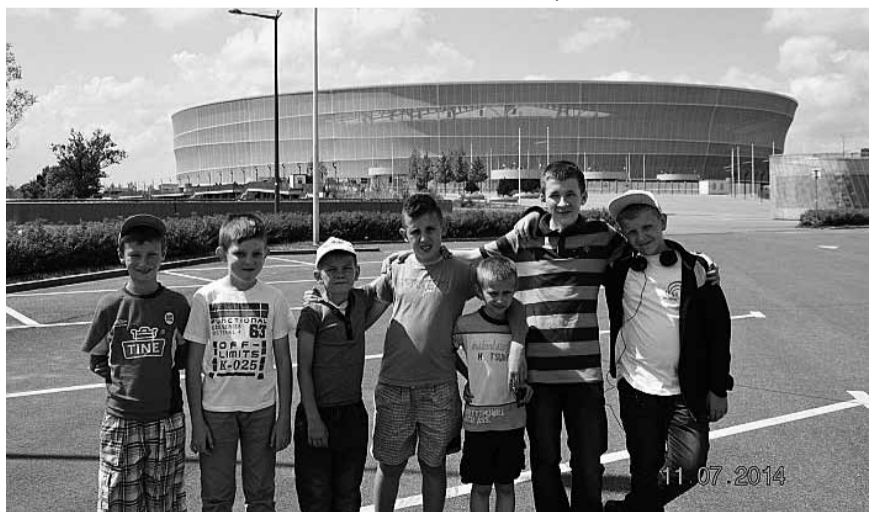
Служачі вивчають місто Вроцлав.