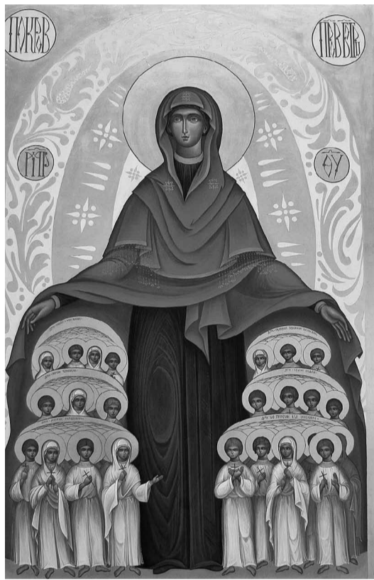
Ікона Покрова Пресв. Богородиці з Ковеля.

Головний мотив встановлення цього празника — це видіння св. Андрія Юродивого. Царгород, столицю Візантії, облягали араби, повсюди в місті панувала тривога. В храмі Пресвятої Богородиці на Влахернах, де переховували Її ризу, відправляли всенічну, храм був переповнений. Саме тоді після відправи св. Андрій Юродивий та його учень Епіфан мали видіння: від царських дверей (так раніше називали головні двері церкви, через які входили до храму) йшла світлом осяяна Богородиця у супроводі Івана Хрестителя та Івана Богослова, при співі великого хору святих. Богородиця підійшла до престолу, вклала, довго молилася і плакала. Після цього, як бачив св. Андрій, вона зняла зі своєї голови хустку-покров-омофор і широко про-