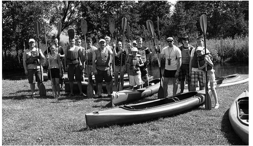
Плавання на байдарках, це корисно і приємно.