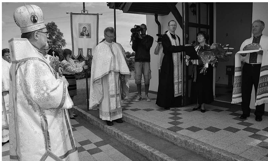
Вітаємо Вас, Владико, в порогах нового хрвму.