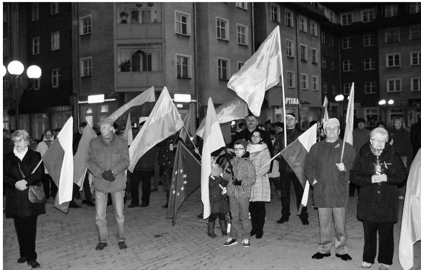
У руках прапори Польщі, України та Євросоюзу.

ли, що хочуть жити в українській державі як європейській демократії. Вийшли на Майдан не задля власної користі, але задля кращого майбутнього.