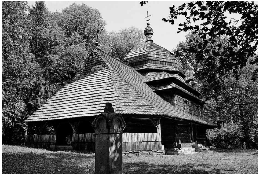
Дерев'яна церква в Улючу на горі Дубник.

Польська влада пильно стежила за старанням українців і всіляко перешкоджала, зокрема в закупівлі землі під будову Народного Дому, не дозволила будівництво на сільських грунтах. Тому просвітяни купили землю в одного господаря на узбіччі гори Дубник. Придбали матеріали для бу-