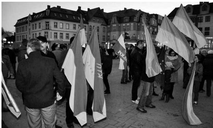
Учасники акції «Солідарні з Україною» на вулицях Щецінка.

Коли відступив Янукович чи втік до улюбленої Росії на Майдані мала місце ще одна важлива подія. 2 березня в неділю Сиропусну коли за східним звичаєм у Церквах відбувається чин прощення, ми були свідками такої молитви на Майдані. Священники та єпископи різних віроісповідань зі сцени на Майдані просили прощення усіх провин в народі. Самі також виявили своє пробачення людям, які так численно прибули на Майдан. Відбулося велике духовне єднання народу перед початком Великого Посту. Думаю, що після таких подій це було потрібне. Як сказав Патріарх Святослав, це був час очищення українського народу. Майдан поміняв людей, це було скидання советсько-російських кайданів. Молоді українці продемонструва-