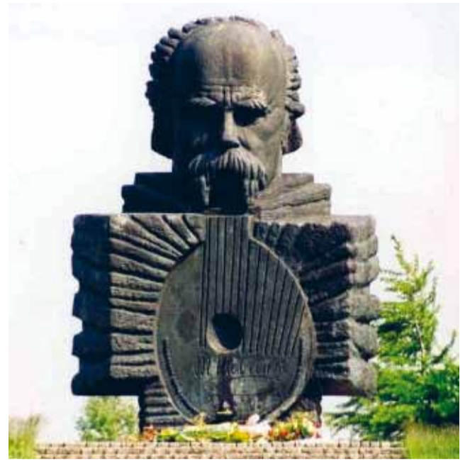
Пам'ятник Т. Г. Шевченкові у Білому Борі.

Вірні греко-католицької парафії у Гурові Ілавецькому