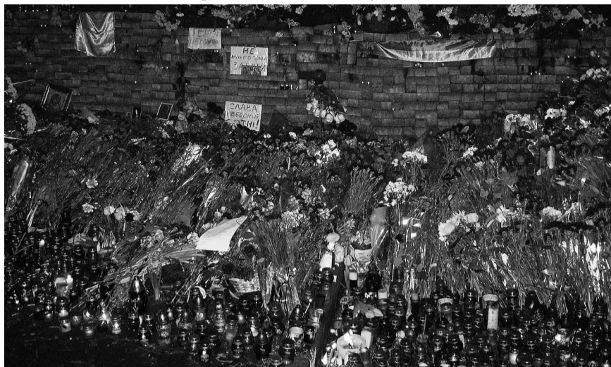
Квіти та лампадки в пам'ять Небесної Сотні.