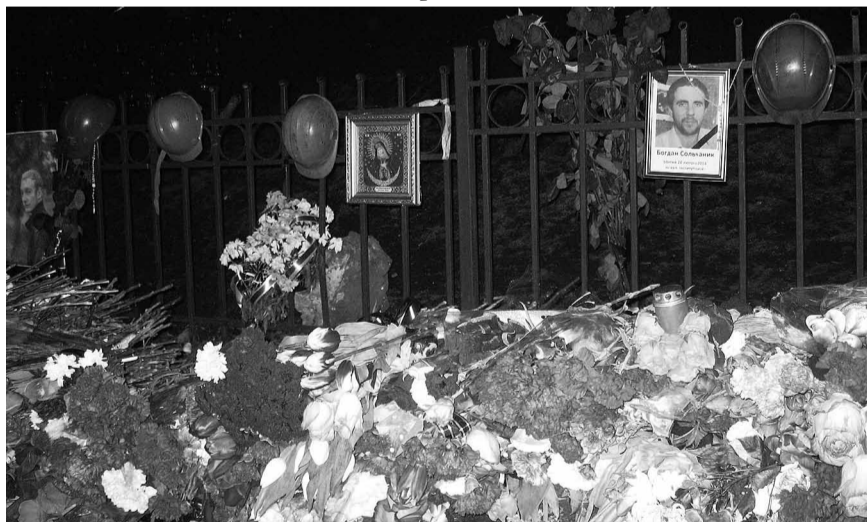
Після них залишилися тільки будівельні шоломи.