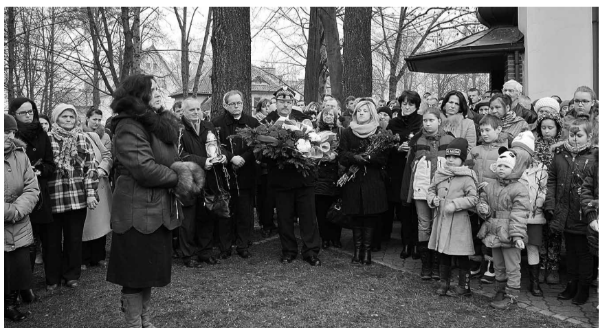
Вшанувати жертви Майдану прибуло чимало парафіян Гіжицька.