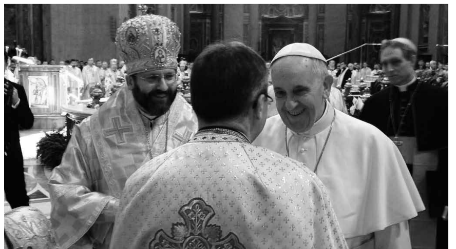
Зустріч владика-номіната з Папою Франциском. 25-11-2013 р.