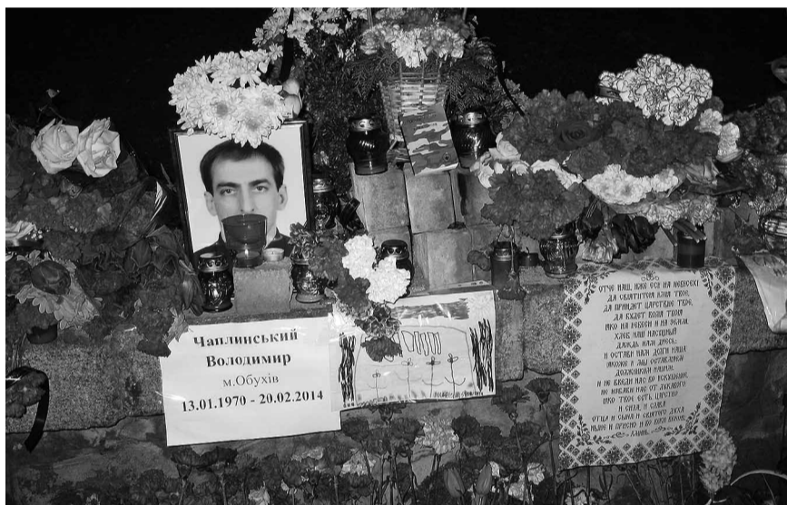
Згадка про вбитих.