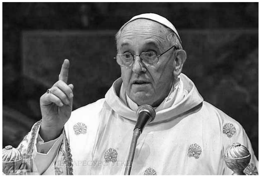
Папа Римський Франциск.

Черговою подією, яка звернула очі Папи Франциска на Україну були протести на Майдані в Києві. Папа заклик весь світ до молитви та просив про мирне розв'язання