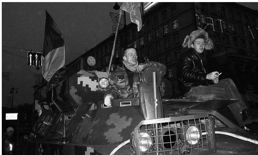
На барикаді на київському Майдані.