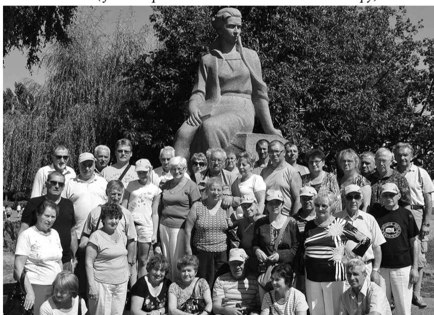
...батьківщину Лесі Українки,