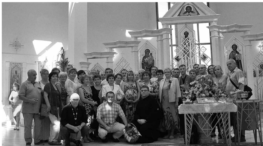
Члени валецької парафії беручи участь у посвяченні Патріаршого собору відвідали Зарванцию...