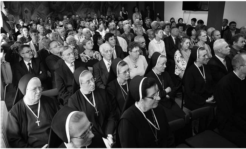
Зустріч з мирянами Вроцлавсько-Гданської єпархії.