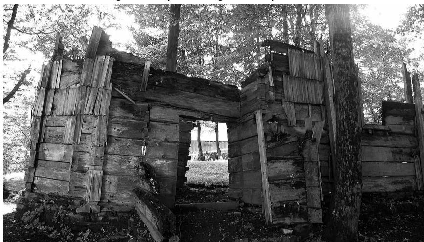
Руїни церкви, які були перевезені до Годкова.