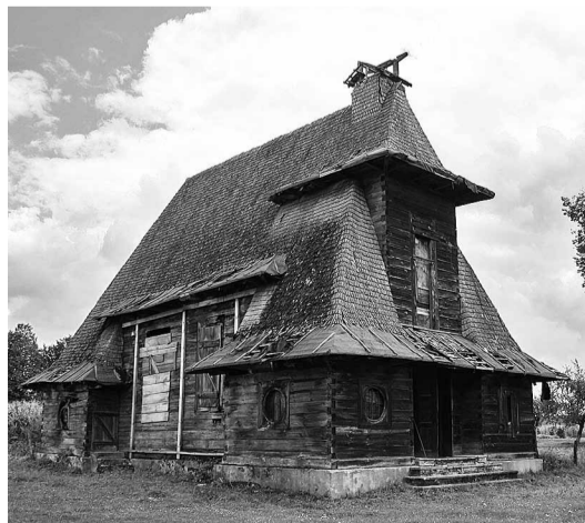
Костел з Язлівчика, перенесений до Львова.