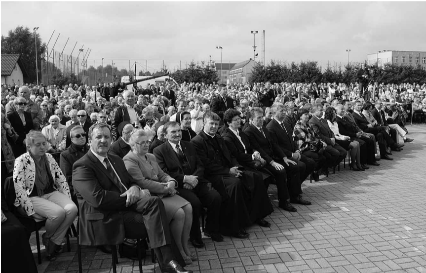
Вірні Вроцлавсько-Гданської єпархії та гості на святковій Літургії.