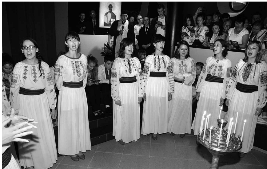
Гданська студентська група Напроти запрошує до розмови.

зуміти, що молитва це духовна розмова з Богом, як вкінці знайти для неї час, щоб знайти промінь світла у своєму житті. В особливий спосіб захопили всіх своїми піснями, які були підготовлені з нагоди цієї зустрічі. Всім так сподобалося, що врешті ціла Церква, включно з Патріярхом, почали співати цю радісну пісню про віднайдення дороги до Бога. На закінчення отримали оплески і ще раз на повторили цю пісню.