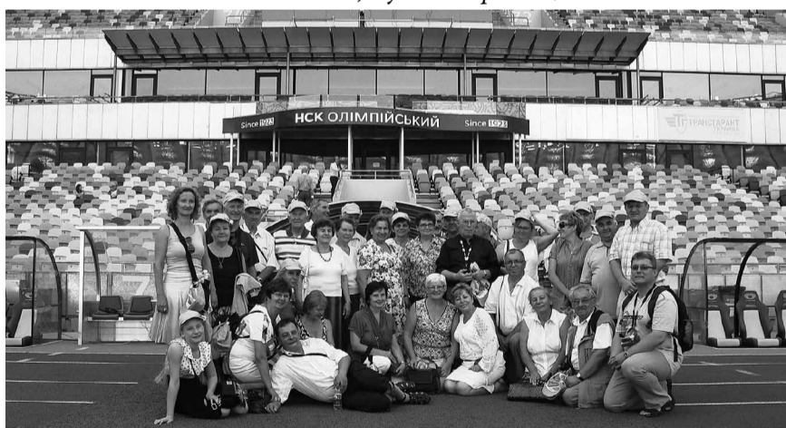
...стадіон, арену, де відбувалися футбольні змагання Євро 2012,