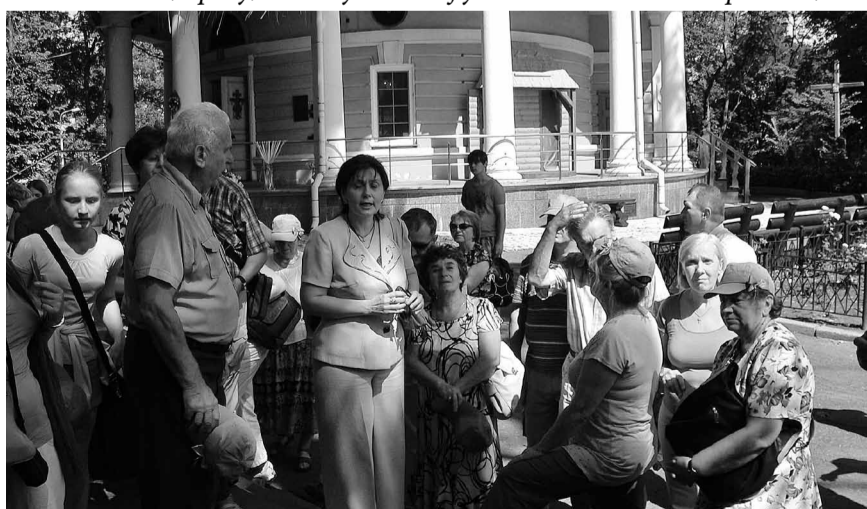
...були у греко-католицькій церкві на київській Аскольдовій могилі.