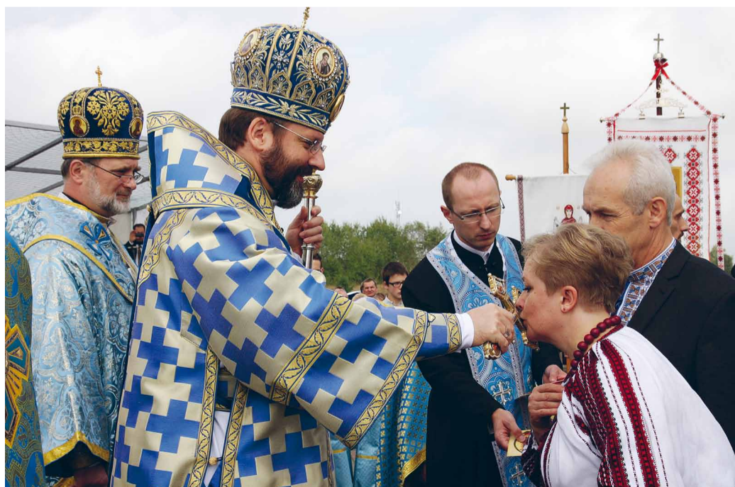
Благословення від Блаженнішого Святослава.