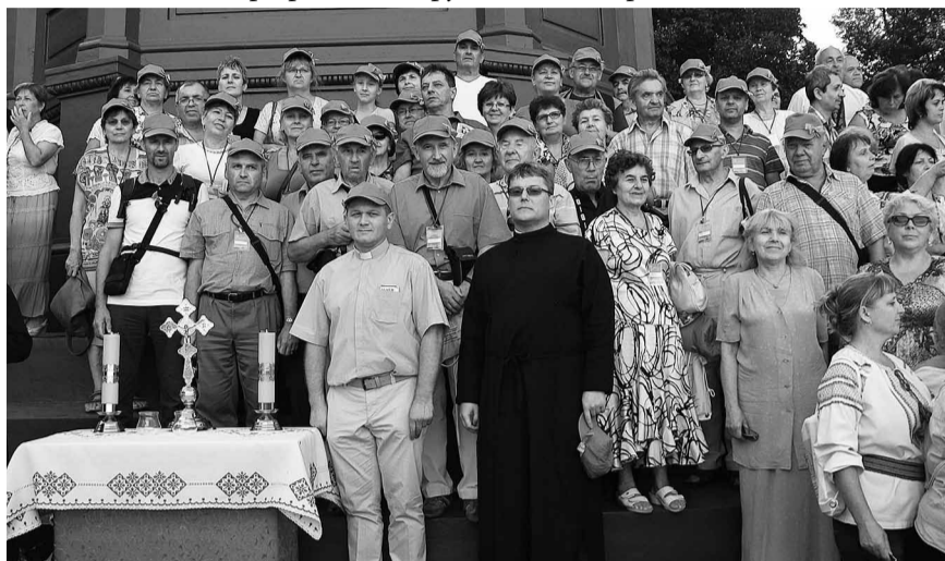
— Київ (фото перед пам'ятником князю Володимирі)...