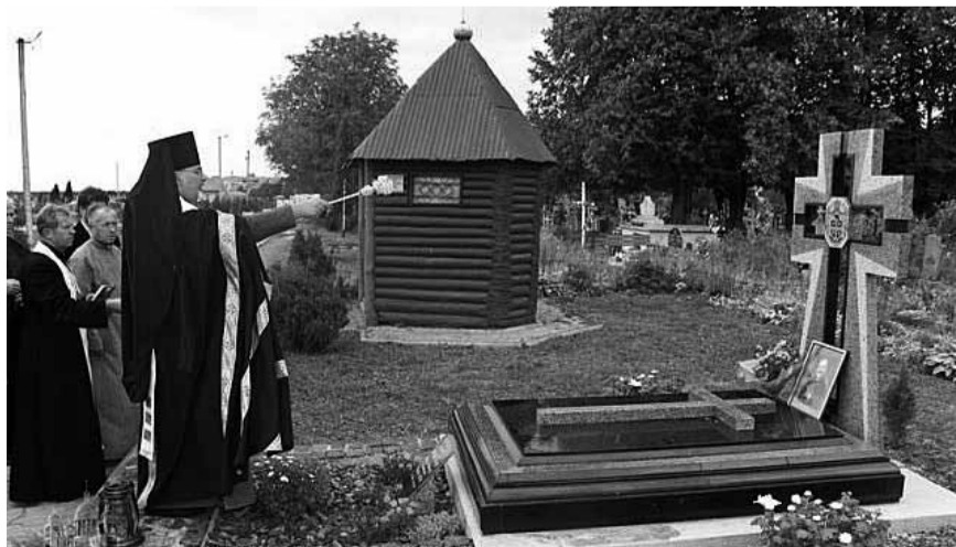
Посвячення пам'ятника на могилі владика Юліяна Гбура у Стрию.