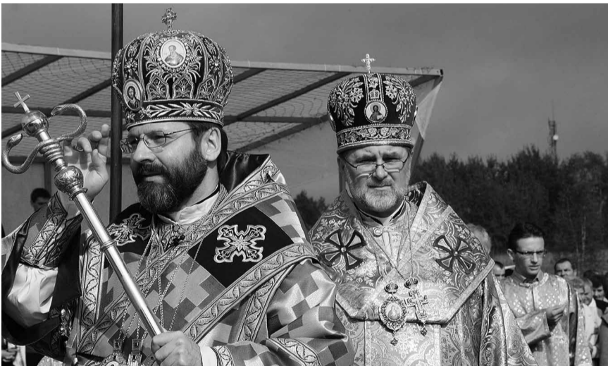
Архиерейську Літургію очолив Блаженніший Святослав Шевчук.