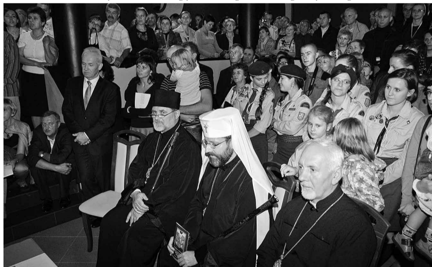
Патріярх на зустрічі з молоддю у білобурській церкві.