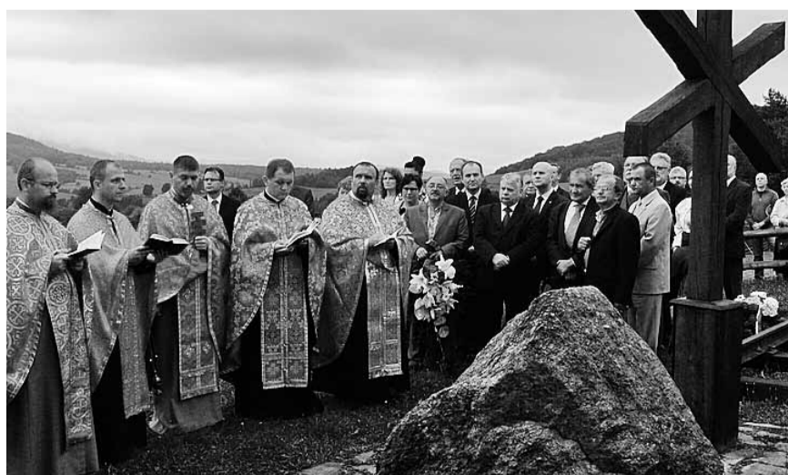
Панахида на ватряному полі перед пропам'ятним хрестом.