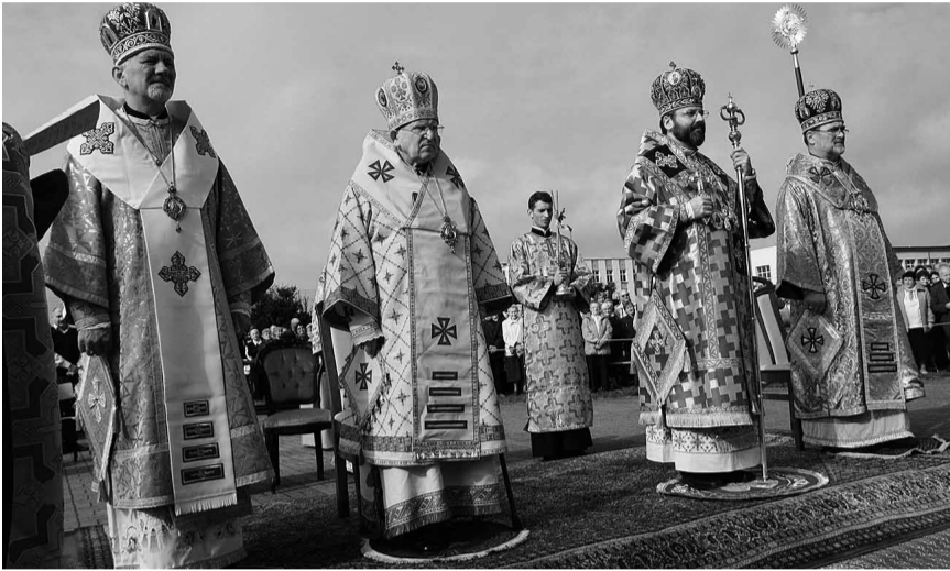
Владика УГКЦ перед храмом Різдва Пр. Богородиці.