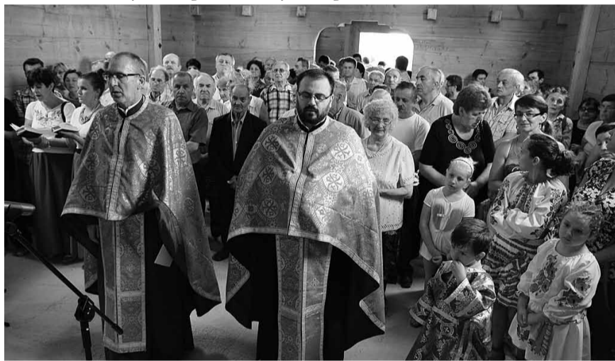
Літургія в день празника св. Володимира Великого.