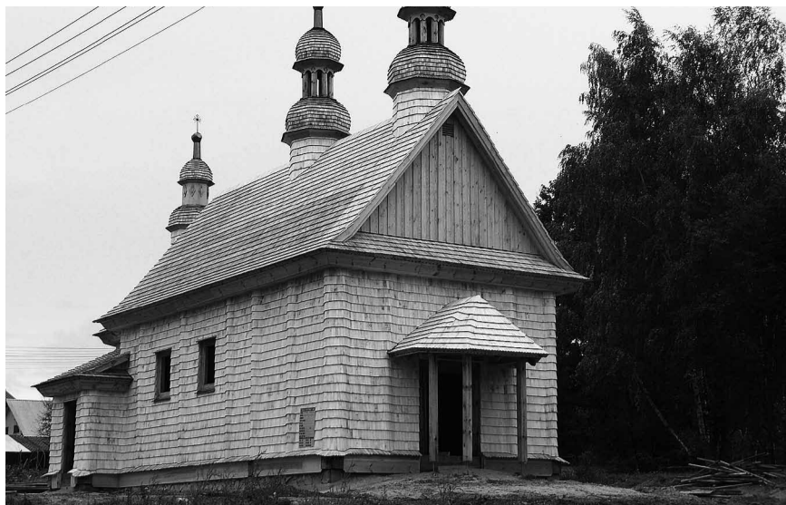
Церква із Купної відроджена у Годкові.