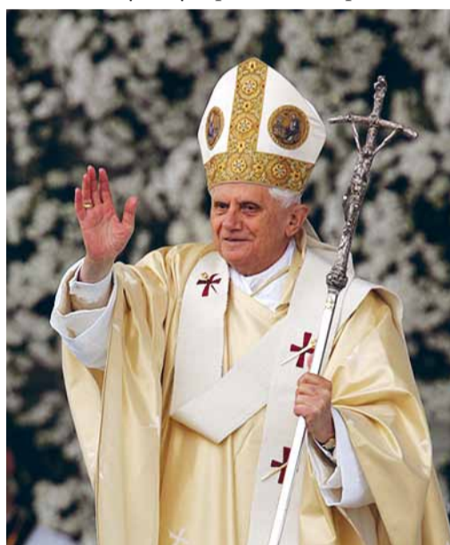
Папа Бенедикт XVI.