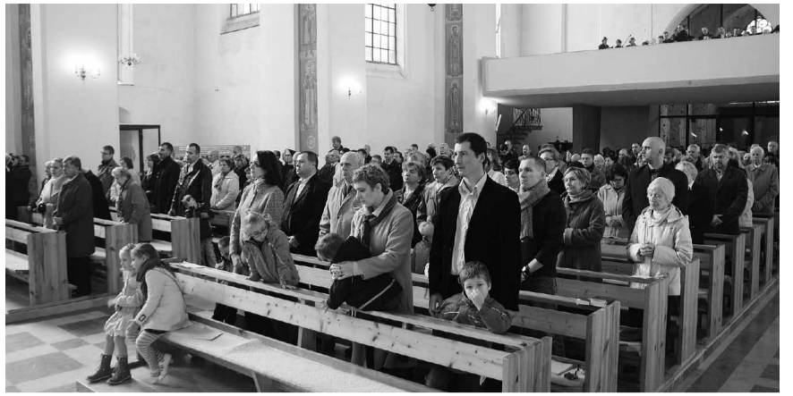
На гданський Ювілей прибули запрошені гості та парафіяни.

Нам завжди потрібна опіка Пресвятої Богородиці. Може не така сама, як перед віками, коли треба було захищати народ у Константинополі перед ворогами, накривати плащем, щоби ніхто не загинув. Потрібна нам опіка немов іншого рівня. Нам потрібно, щоби Пресвята Богородиця захищала нас перед нами самими, кожного з нас перед його ліниством, перед байдужістю до вірності своїй традиції, свому народу, своїй мові. Перед тим, чому сьогодні та легко піддаємося, вибираємо скоріше це, що корисне, що приємне, що полегшує життя. Отже, нам дійсно потрібно опіки і мудрості. Особливо потрібний нам захист перед небезпеками, які можуть бути в нас самих, не перед цими зовнішніми, їх можна побороти скоріше, але перед внутрішніми, з якими дійсно треба сильно воювати. Так як колись, ми і сьогодні пови-