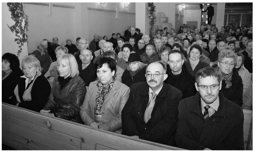
Запрошені гості та вірні на празничній Літургії.