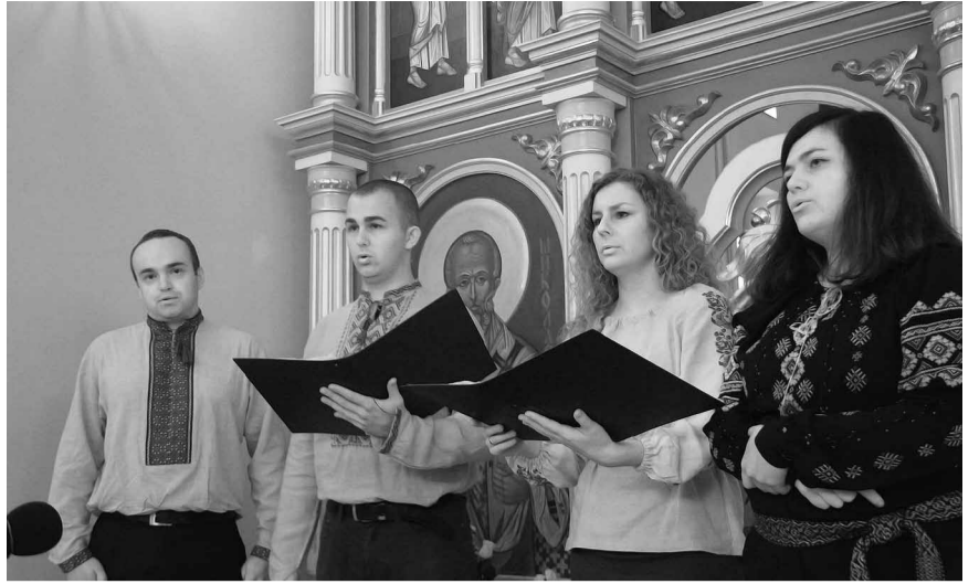
Молодь про переселення.