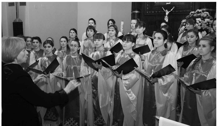
Молодіжний хор з Дрогобича.