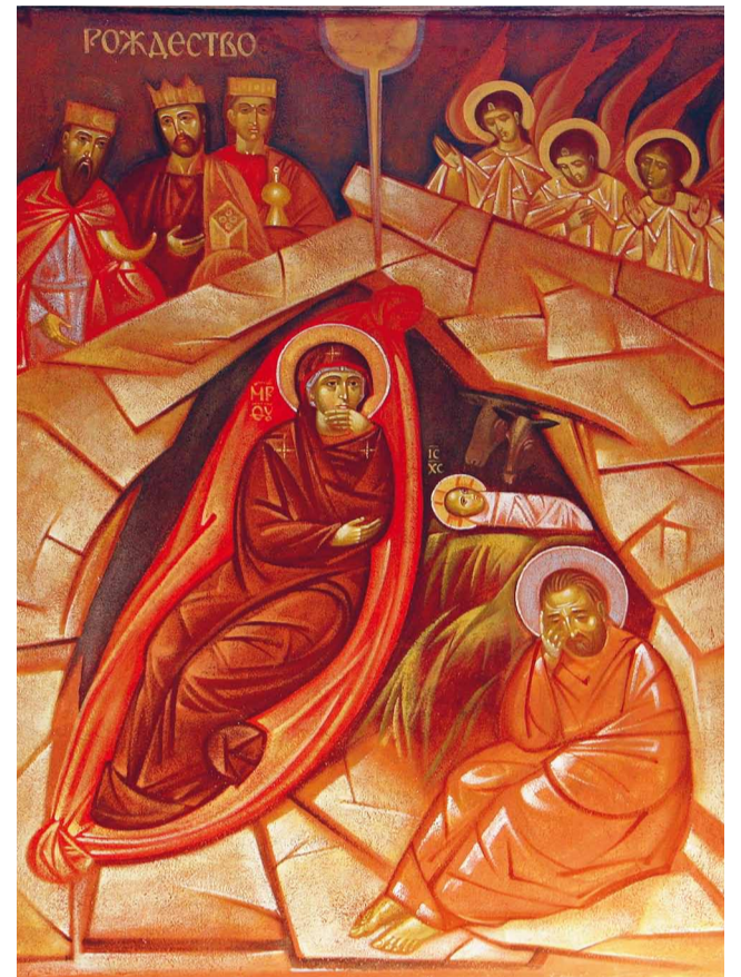
А. Дутка — фреска із гданської конкattedри.