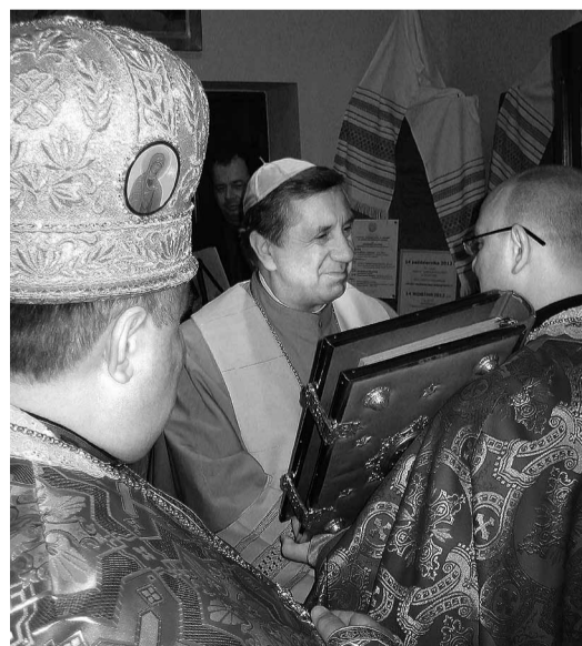
Привітання єпископа Анджея Дзенги, Митрополита Щецінсько-Каменського.

Після переселенської акції «Вісла» вірні нашої Церкви опинилися у великому розпорощенні. Найчастіше довелось їм жити без душпастирів, яких або вивезли у Сибір, або арештували і затримали в концтаборі в Явожні. Щойно після 1956 року, коли змі-