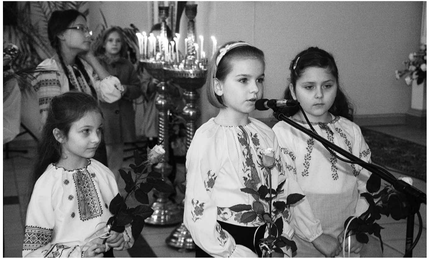
Квіти від наймолодших.