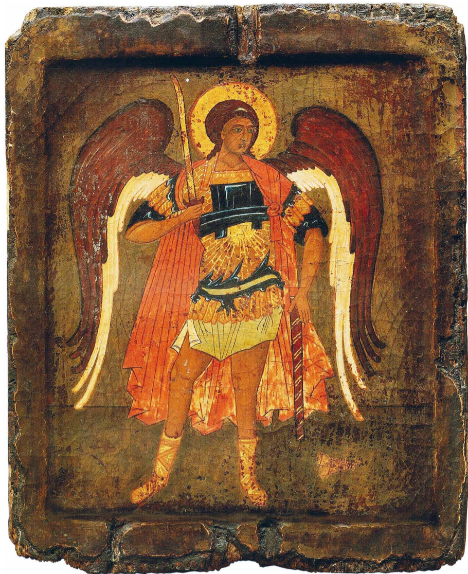
„Всі небесні Сили, святі Ангели й Архангели, моліть Бога за нас грішних”. (Велике повечір'я)