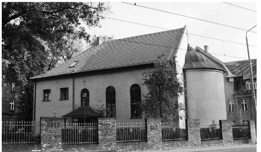
Церква у Щеціні.