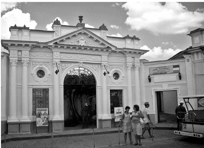
Вхід до караїмської кенаси м. Євпаторія.