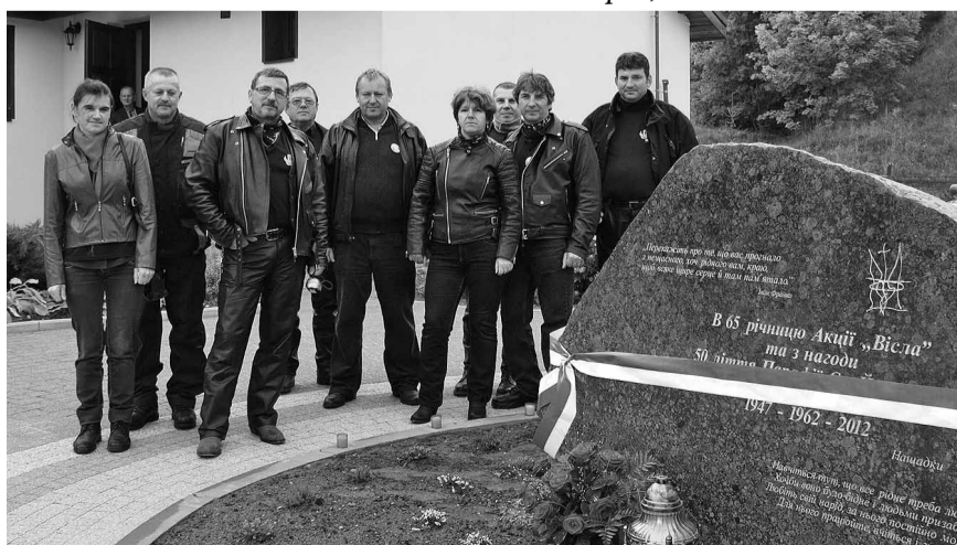
Українські байкери перед пропам'ятним каменем.