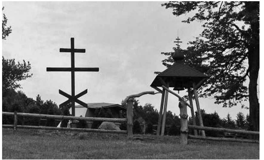
Площа з хрестом, де відправлено Панахиду за жертви акції „Вісла”.

Питаю, чому Православна Церква не шукає зближення, такого екуменічного, чому не спонукає до християнського єднання всіх мешканців Лемківщини? Як в такому разі браття православні вчить любові до ближнього? Хто є ваш ближній? Маємо свої Церкви і за їх посередництвом реалізуємо свої духовні потреби. Христос, якого проповідуємо