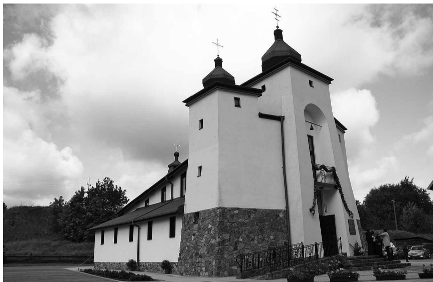
Церква св. Йосафата в Круклянках..