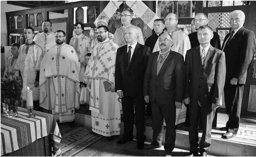
Спільне фото священників та достойних гостей.