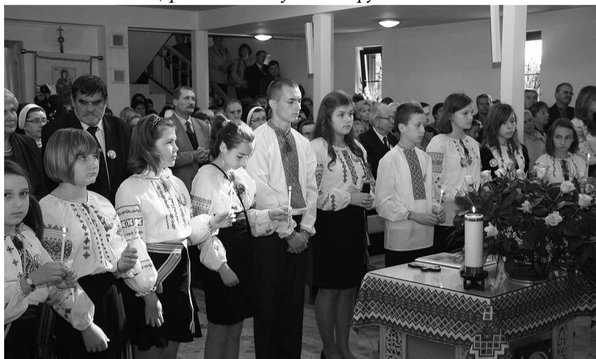
Свічі на згадку тих, що відійшли.