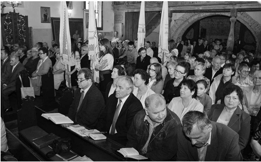
На першому плані — хор циганецької парафії.