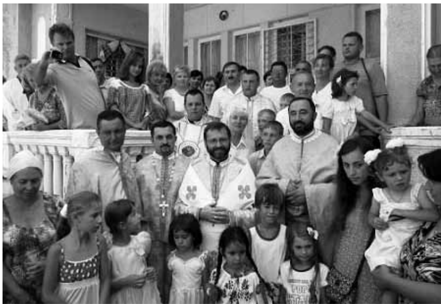
Візит Глави УГКЦ Блаженнішого Святослава. Липень 2011 р.

Щодо духовного життя, то Євпаторія має стару частину міста, яку називають малим Єрусалимом, що включена ЮНЕСКО в десятку рекомендованих екскурсійних маршрутів для відвідування