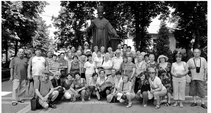
Збірне фото учасників прощі.