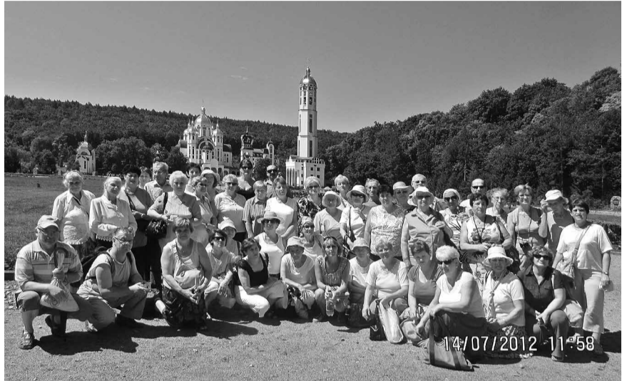
Зарваниця — місце де кожного року збираються тисячі українських паломників з цілого світу.

побачити відбитку Богородичної стопи в місцевій лаврі.