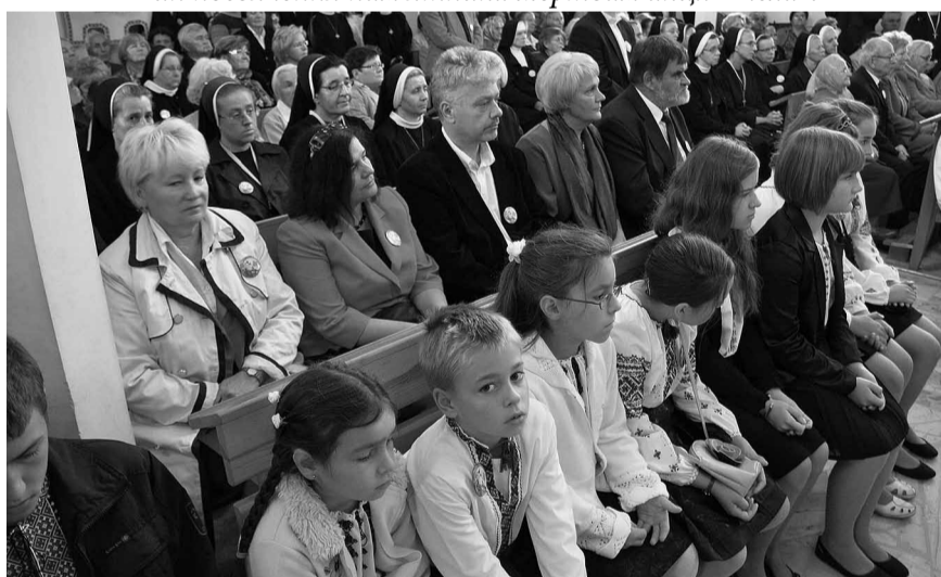
Серед запрошених гостей — представники місцевої та воєвідської адміністрації.