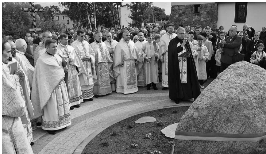
Чин посвячення пам'ятника жертвам акції «Вісла».