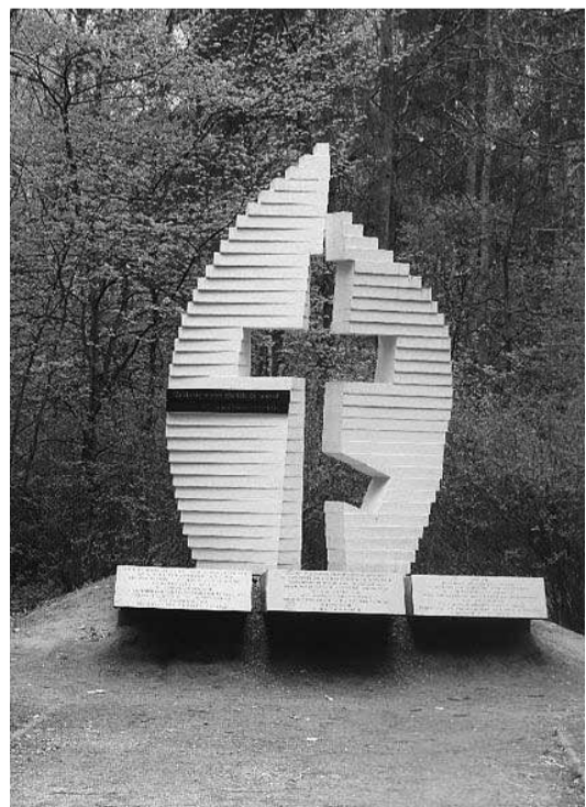
Пам'ятник жертвам концтабору в Явожні.