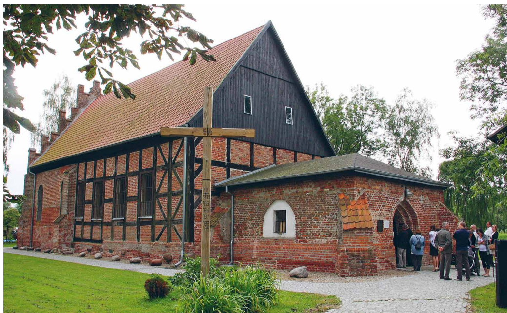
Церква у Циганку.