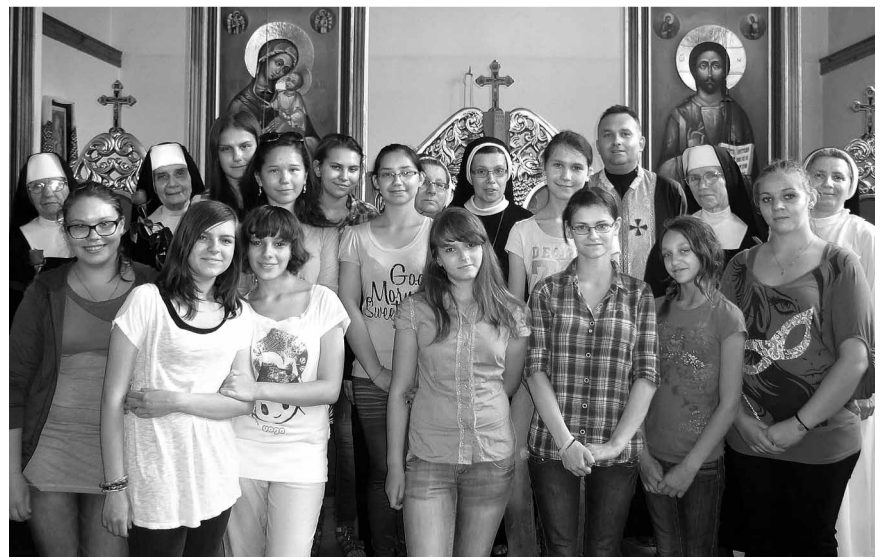
Гості та господарі горлицького монастиря.