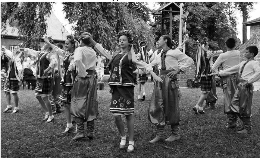
Виступ юних танцюристів із Сарн.

25 серпня 2012 року греко-католицька парафія в Циганку відзначала 60-ліття свого існування на поселенні. Якраз шістдесят літ тому першу літургію (14 березня 1952 р.) у місцевому храмі для своїх вірних в рідній мові відправив о. Василь Гриник, який служив тут (за винятком двох років, коли-то було його арештовано) аж до 1968 року.