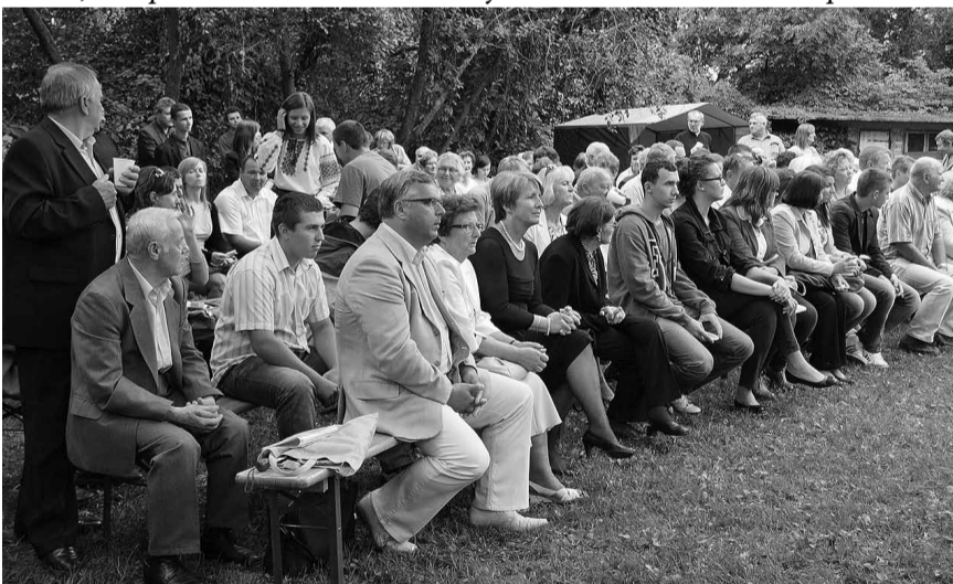
Після літургії час на дозвіля.