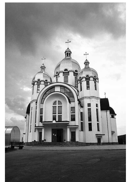
Головний собор зарваницького відпустового центру.

помогти, коли він Тобі потрібний візьми його собі на службу. З того часу дух життя повернувся до дитини. Коли по закінченні львівської семінарії приймав свячення в безженному стані, багато хто цьому дивувався. Сьогодні ми бачимо — продовжував Патріярх Святослав розповідь — як Господь Бог готував провідника для нашої Церкви на час лихоліття, а для нас святця