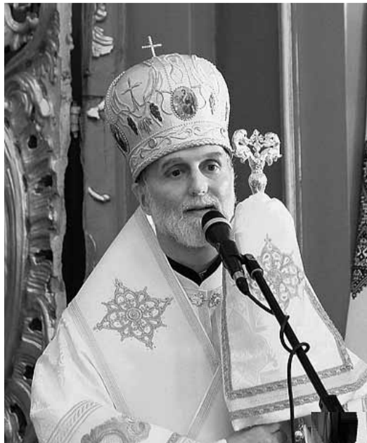
Владика Борис Гудзяк.

Нововисвячений єпископ Борис (Гудзяк) подякував усім присутнім і тим, хто долучився до формування його покликання: «Сьогодні