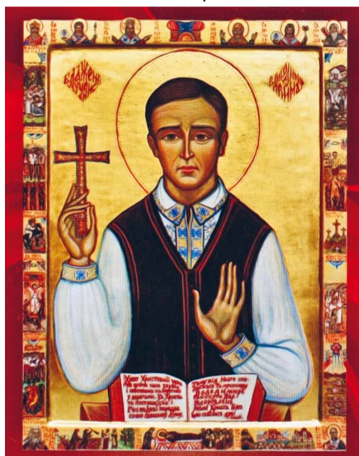
Блаженний Володимир Прийма.

Крім того, синодальні отці скерували окреме Пастирське послання до мирян УГКЦ. У ньому вони подякували Богові за дар святого Хрещення, яким Господь поблаго-